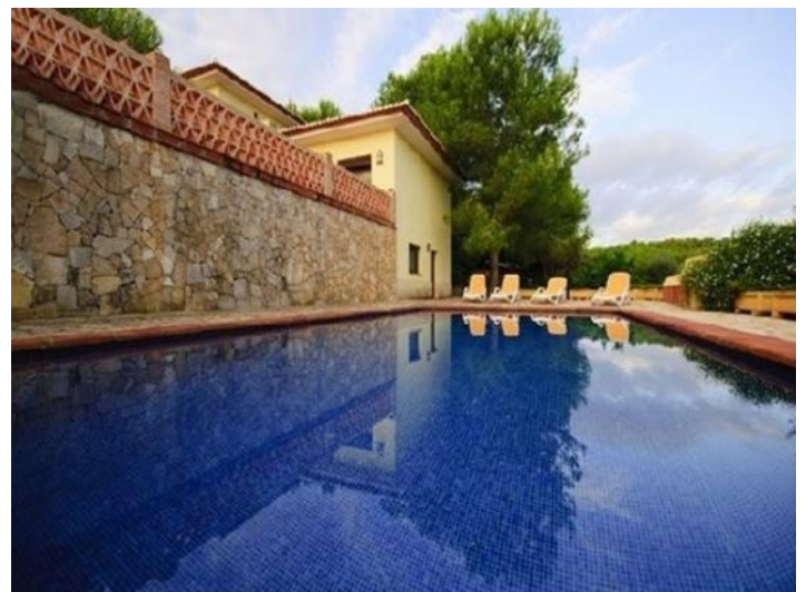
Der große, paradisiische Pool