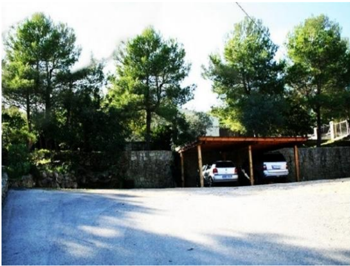
Das Carport mit Platz für 2 Autos