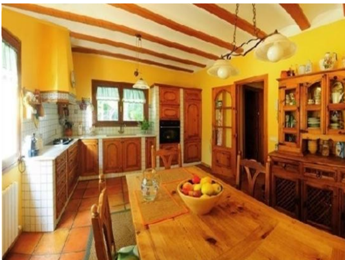
Die großzügige, lichtdurchflutete Küche