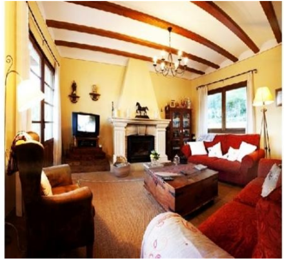
Der exquisite Wohnbereich im rustikalen Stil mit Kamin und