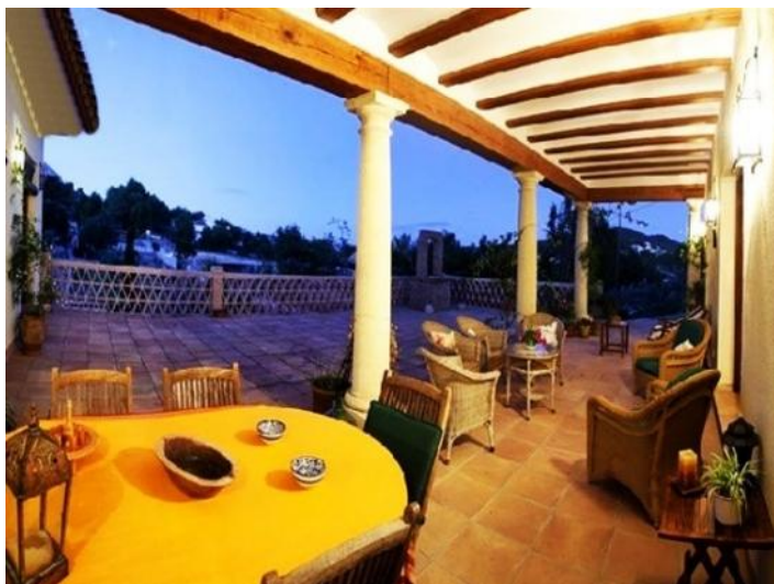
Die exzellente überdachte Terrasse mit vielen Plätzen zum