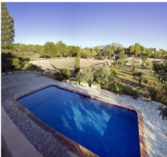
Der große, paradisiische Pool