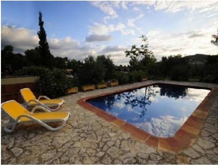
Der große, paradiesische Pool auf der umwerfenden