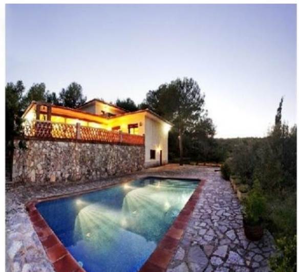
Der große, paradisiische Pool auf der umwerfenden Terrasse