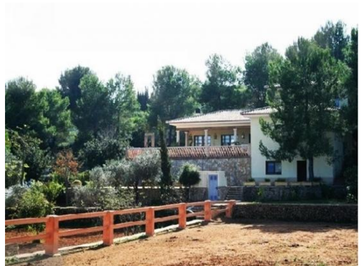
Das imposante Anwesen mit Reitplätzen und Pferdekoppeln