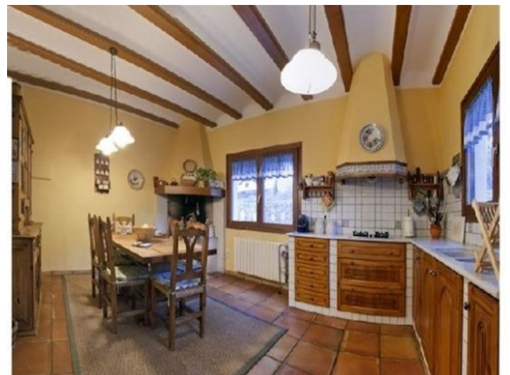
Die großzügige, lichtdurchflutete Küche