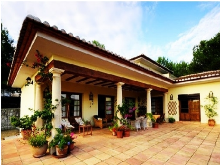
Die großartige, teils überdachte Terrasse