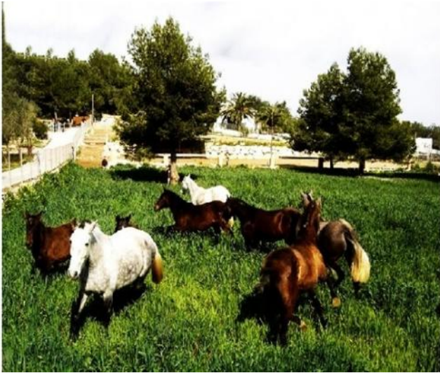
Die große Pferdekoppel, mit einigen der wunderschönen,