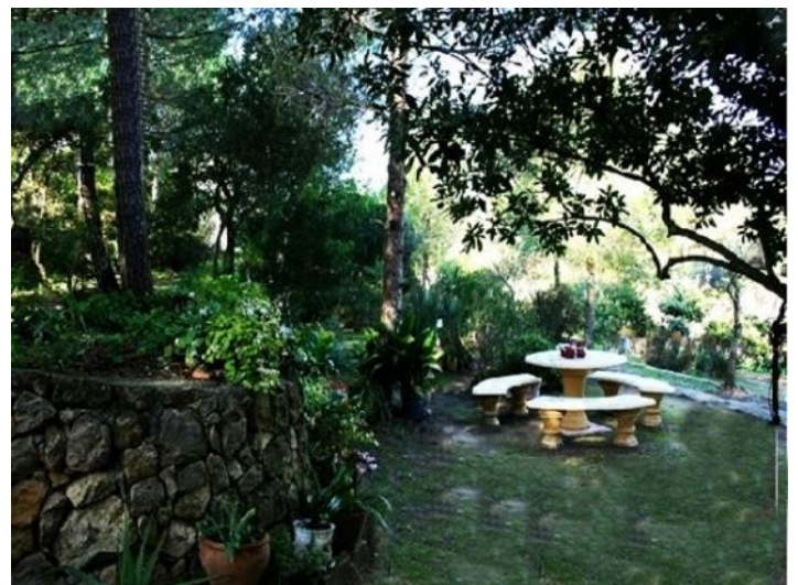
Der himmlische Außenbereich mit vielen Plätzen zum entspannen