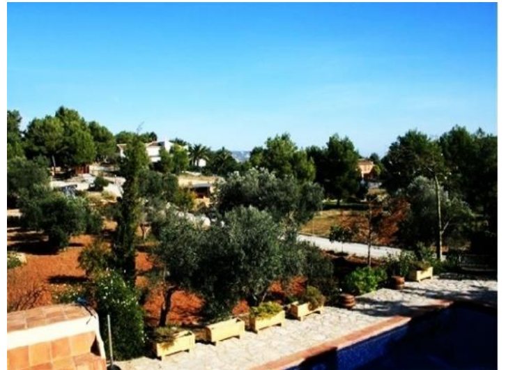
Der riesige Außenbereich