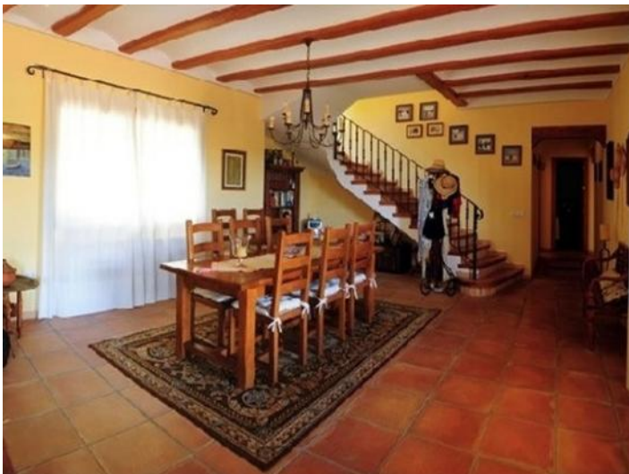
Der gemütliche Wohn-Essbereich