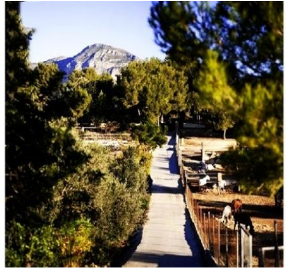
Der märchenhafte Außenbereich