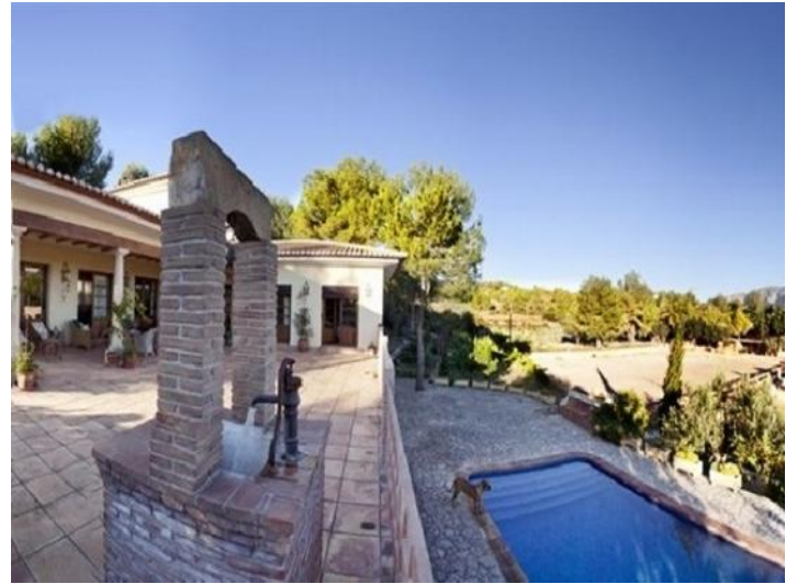
Der große, paradiesische Pool auf der umwerfenden