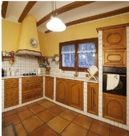
Die großzügige, lichtdurchflutete Küche