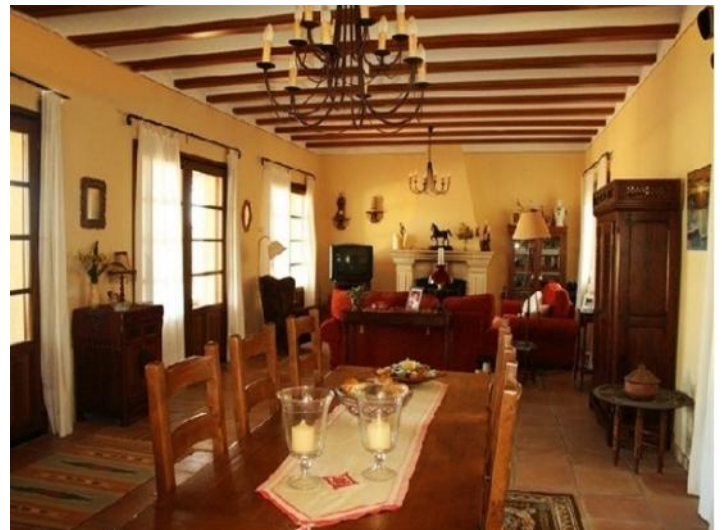
Der gemütliche Wohn-Essbereich