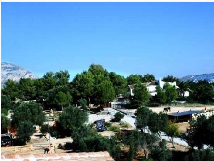
Der riesige Außenbereich