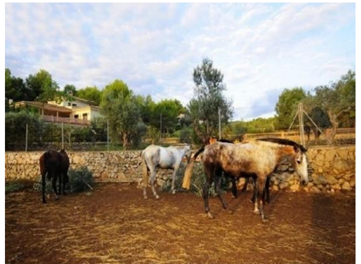
Die große Pferdekoppel, mit einigen der wunderschönen, topgepflegten Pferde