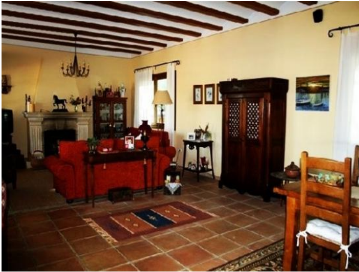
Der exquisite Wohnbereich im rustikalen Stil mit Kamin und