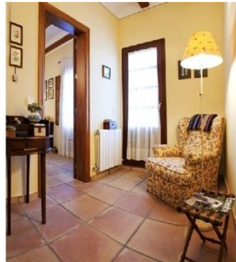
Das wunderschöne Interieur im rustikalen Stil