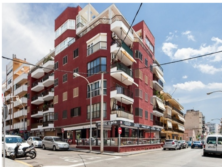
Blick von der Straße auf das Restaurant