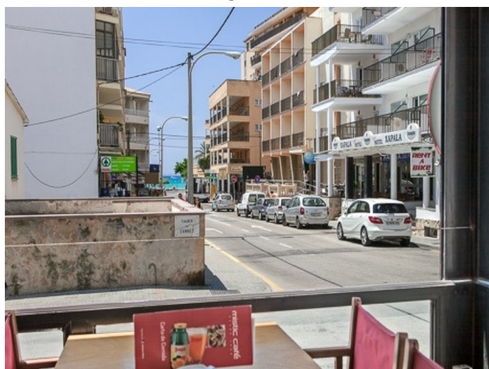
Blick von der Terrasse auf die Straße