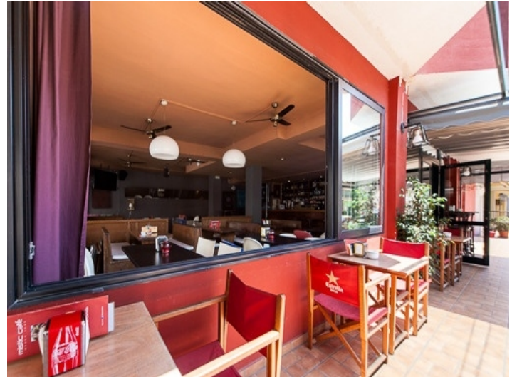
Blick von der Terrasse in den Essbereich