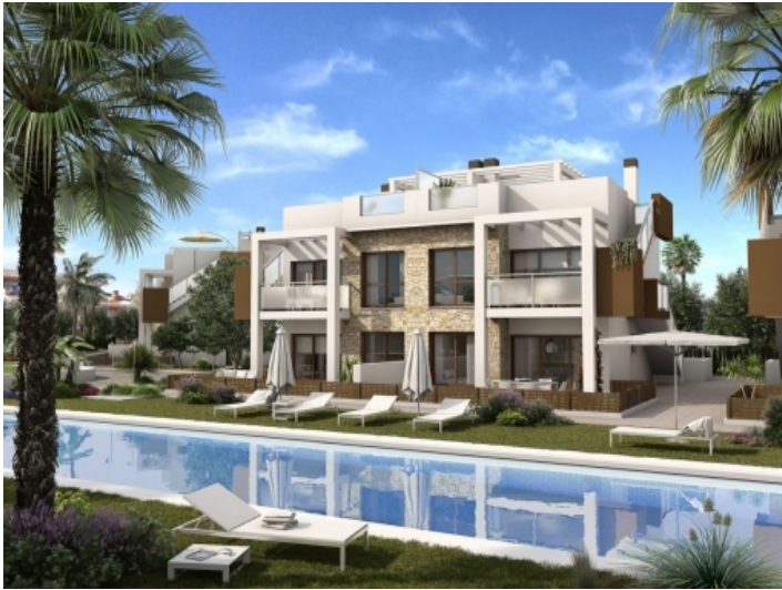
Außenansicht des Komplexes mit Pool