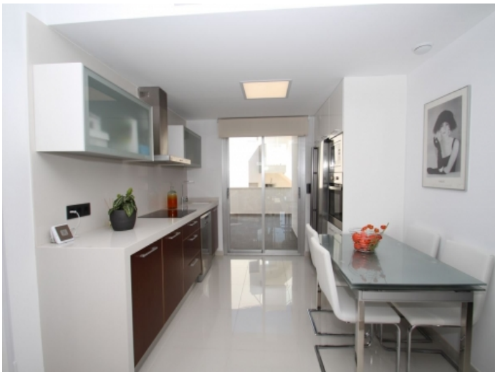
Moderne Küche und Essbereich