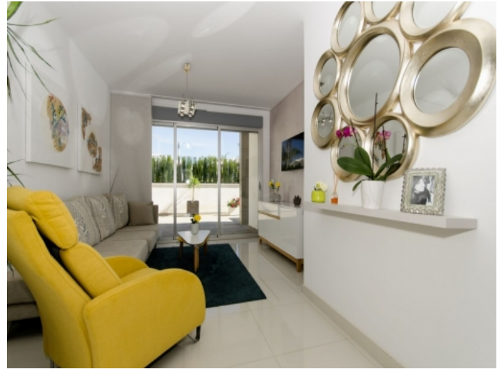
Gemütlicher und heller Wohnbereich