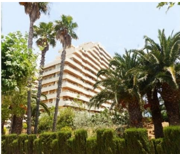
Der beliebte Wohnkomplex in Calpe, direkt am Meer gelegen