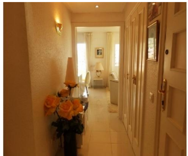
Das bezaubernde Interieur des Penthouses