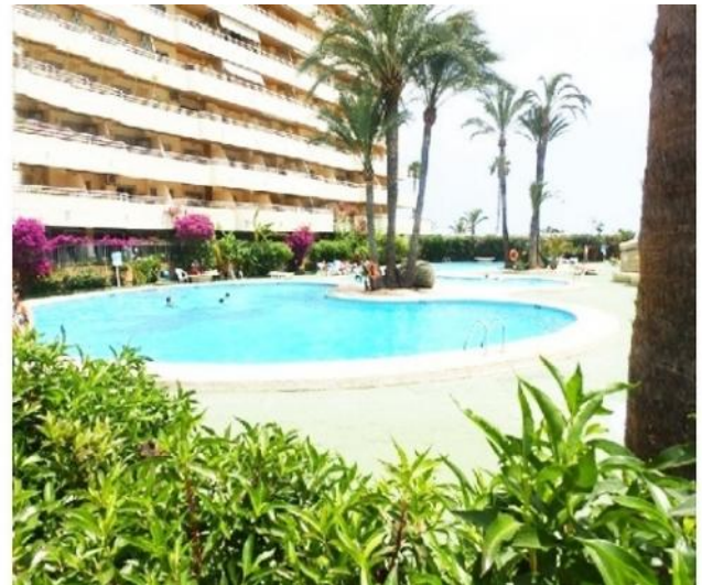
Der exzellente, gepflegte Gemeinschaftspool der beliebten Wohnanlage