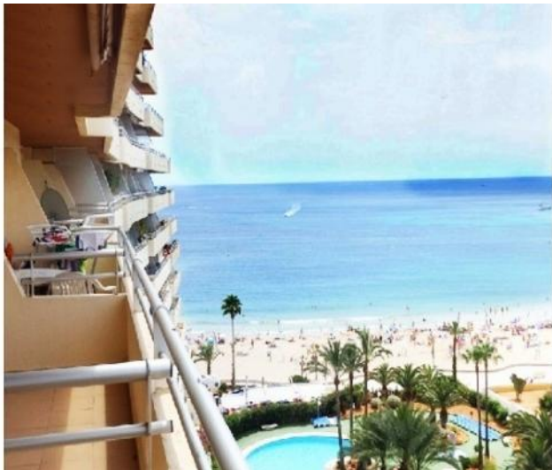
Der atemberaubende Ausblick auf den malerischen Strand von