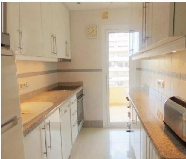
Die großartige Küche des Penthouses mit feinsten Ausstattung