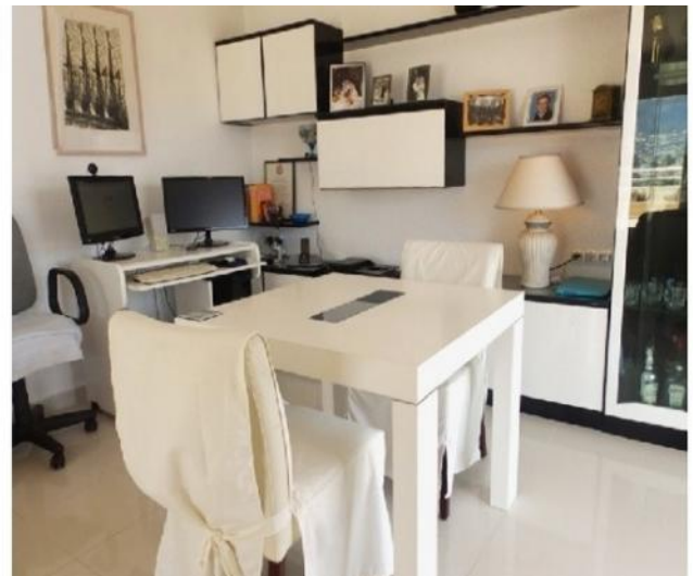
Der hinreißende Essbereich der Villa, ebenfalls mit direktem