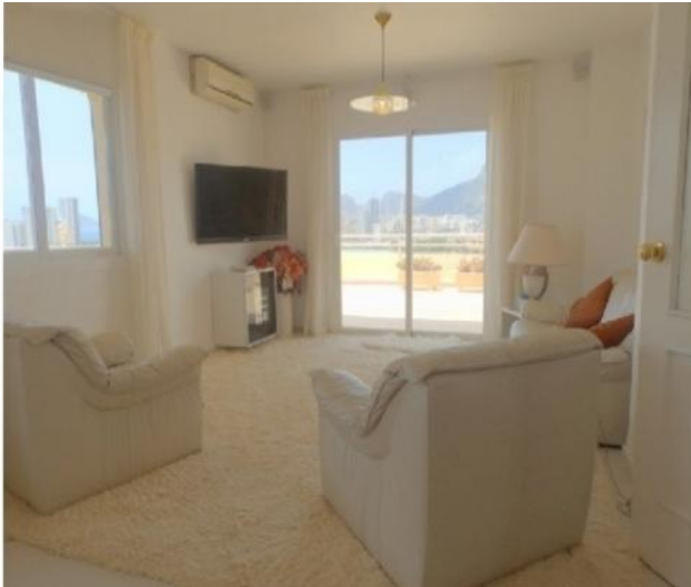
Der exquisite Wohnbereich mit traumhaften Interieur