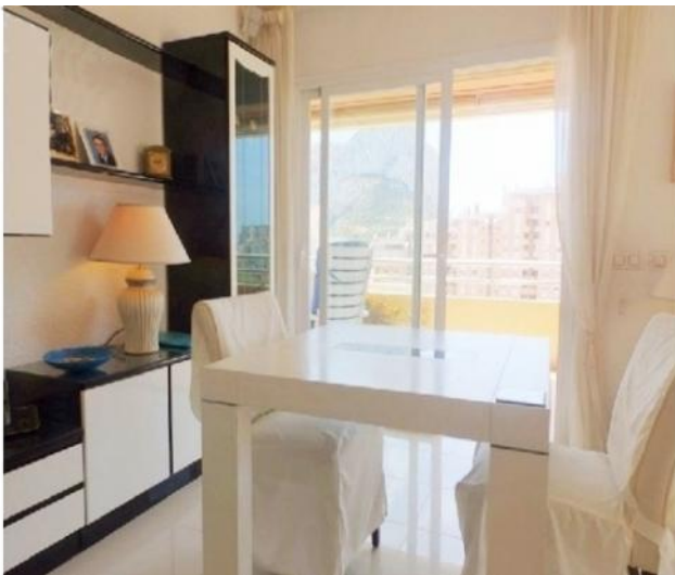
Der hinreißende Essbereich der Villa, ebenfalls mit direktem