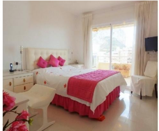
Eines der noblen Schlafzimmer mit riesiger Fensterfront und