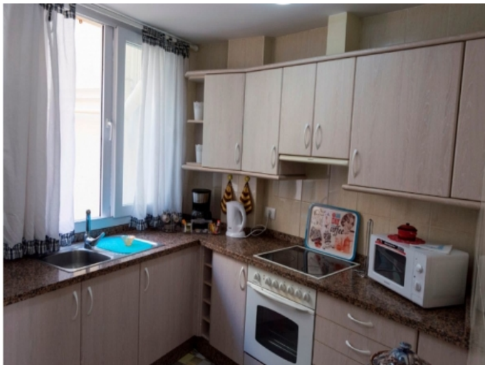
Voll ausgestattete Küche