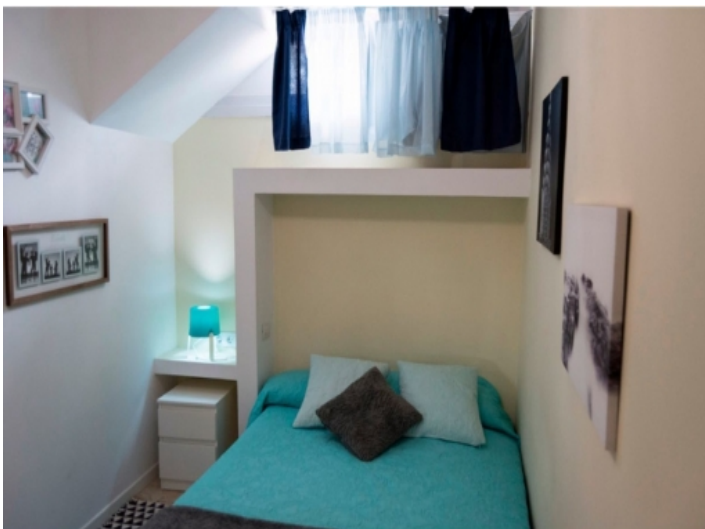
Das zweite Doppelschlafzimmer