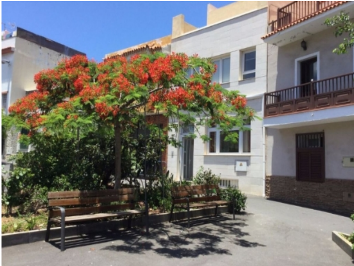
Außenansicht der Wohnung