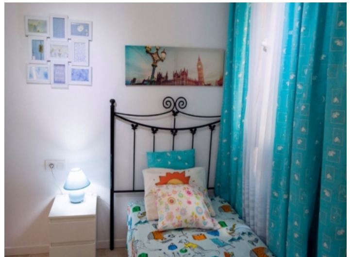
Das dritte Schlafzimmer mit Einzelbett