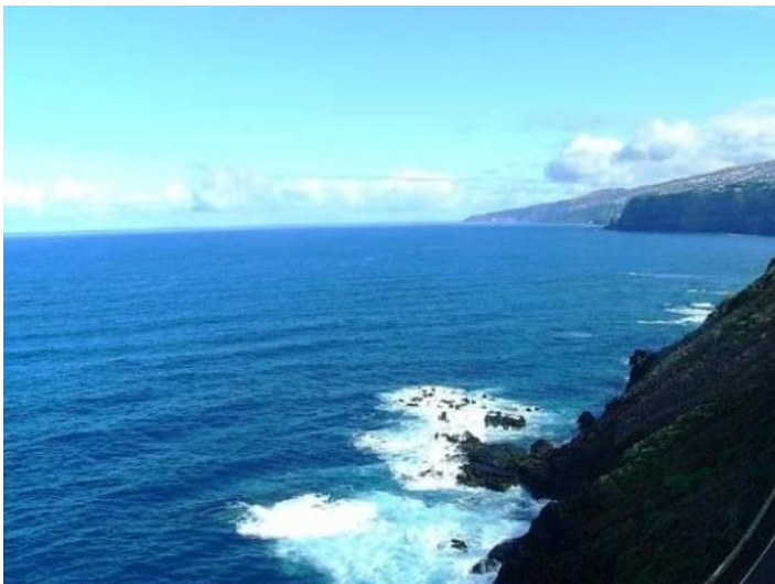
The view on the rocky cliffs