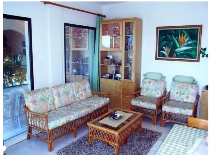
Other view of the living area