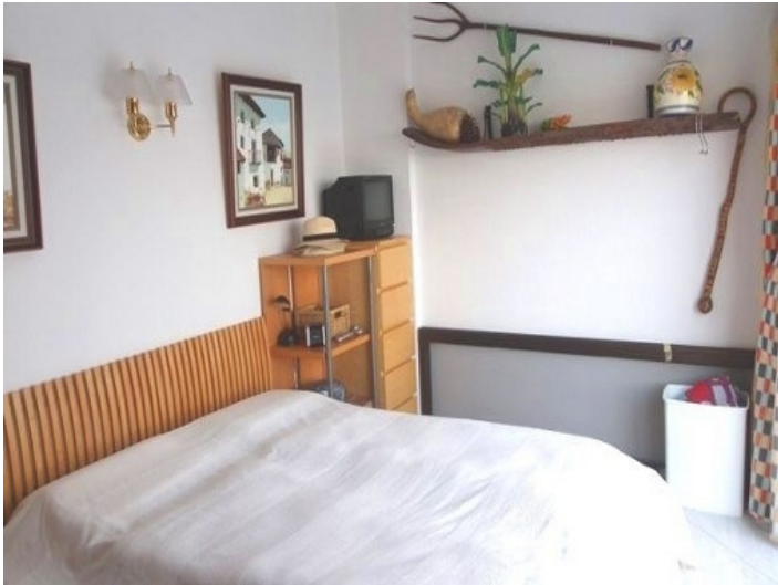
Another perspective of the bedroom