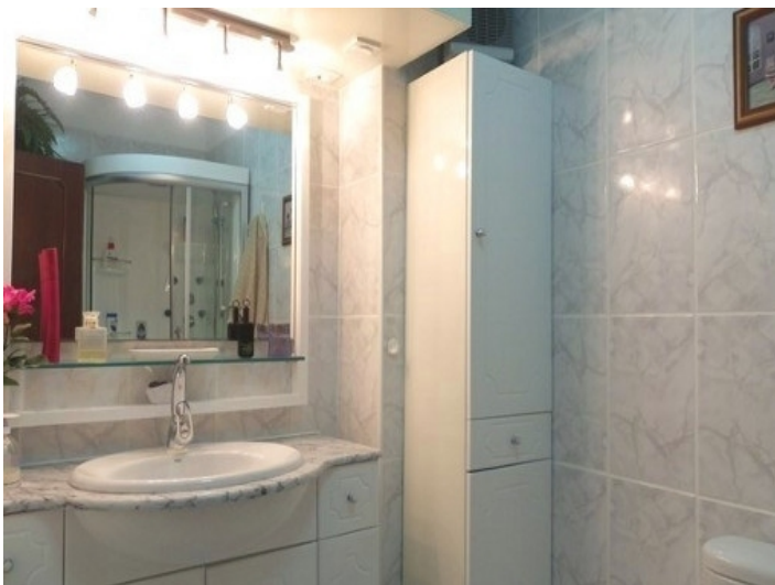
The bathroom with shower with massage jets