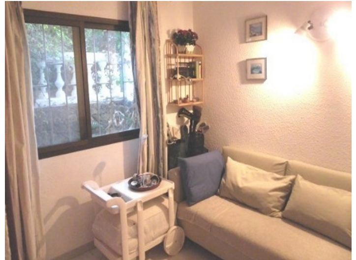
The second bedroom