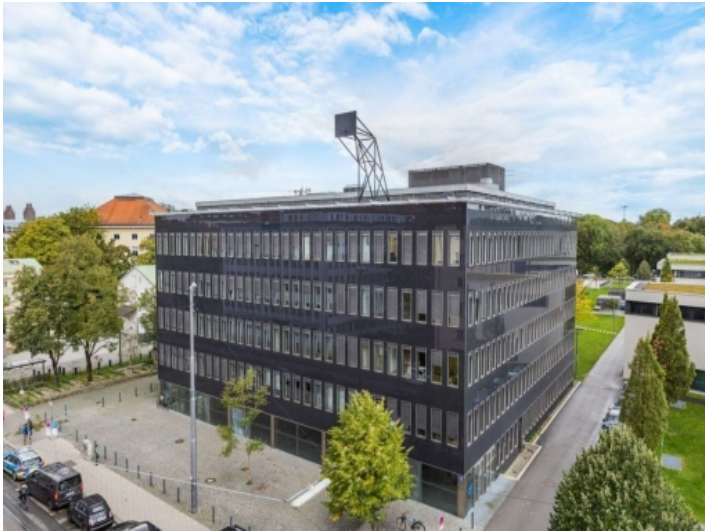
Außenansicht des Wohnhauses