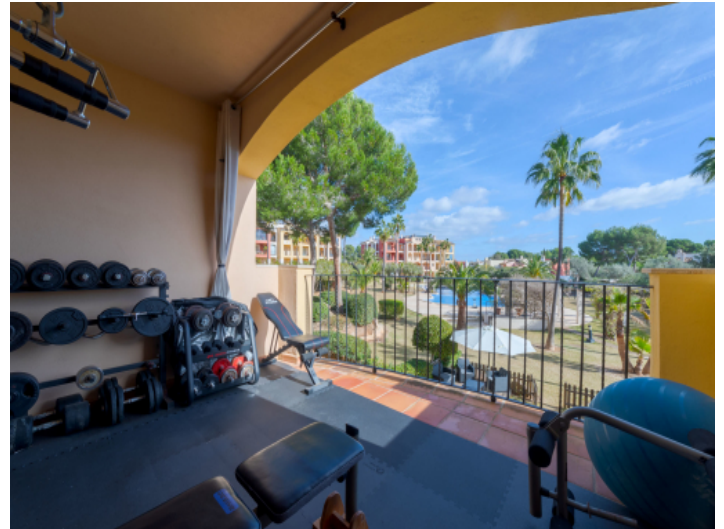
Überdachte Terrasse mit Weitblick