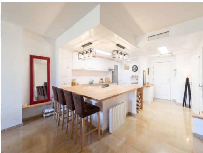
Küche mit Frühstückstheke