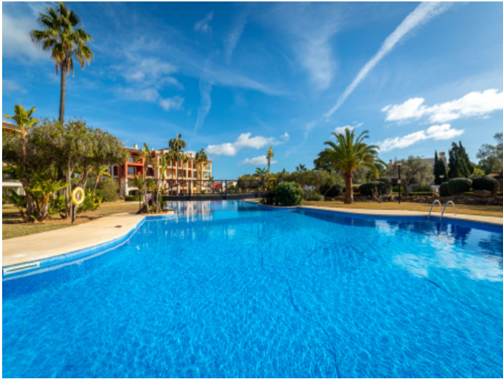
Sehr gepflegter Gemeinschaftspool