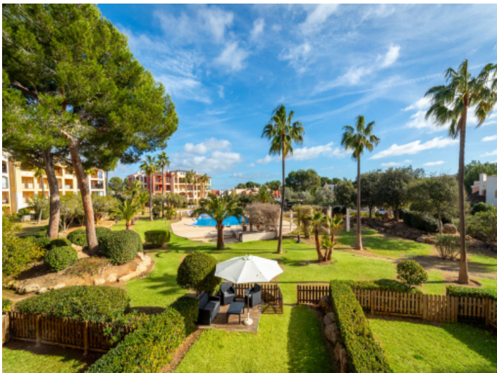
Blick über den privaten und gemeinschaftlichen Garten