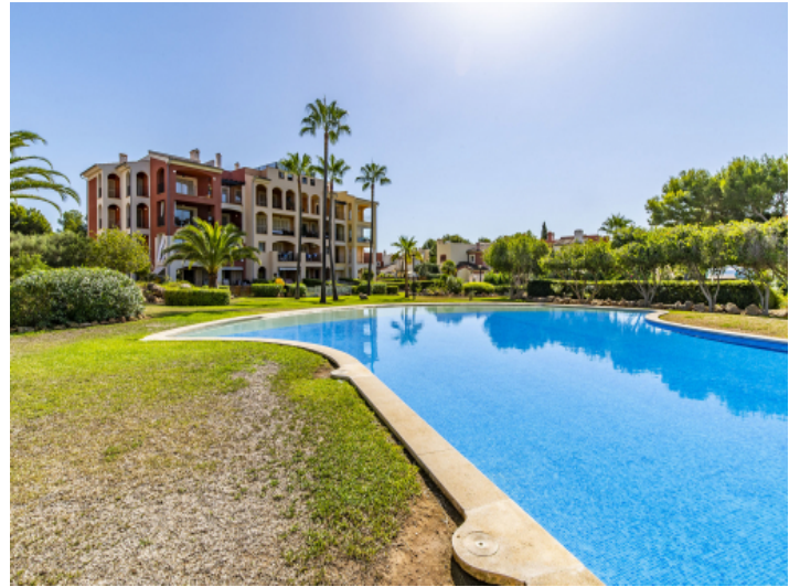
Blick vom Pool auf das Wohnhaus