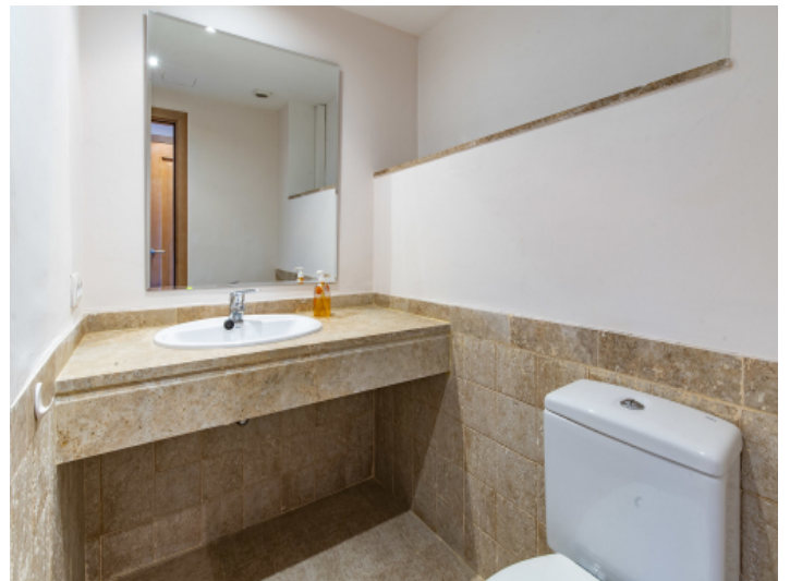
Badezimmer für Gäste