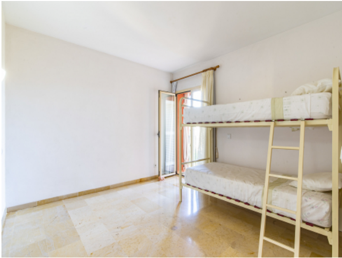
Schlafzimmer mit Hochbett