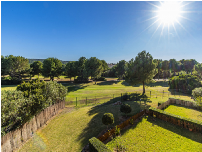
Blick auf den Golfplatz vom Balkon