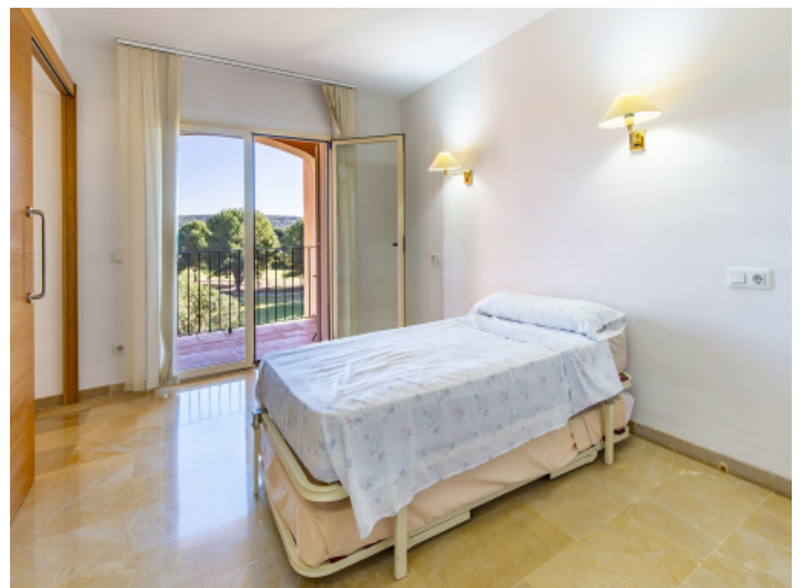
Schlafzimmer mit Balkonzugang