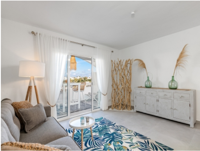
Geschmackvoll renovierte Wohnung