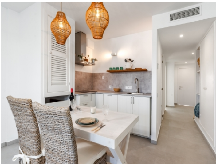
Offener Küchen-und Essbereich