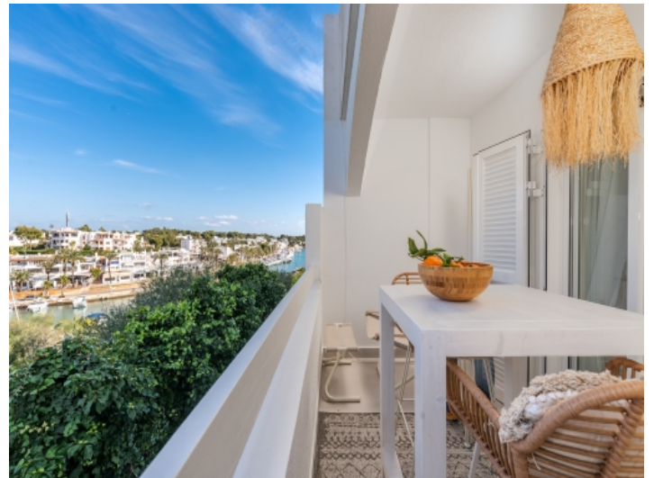
Balkon mit Meerblick