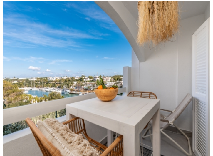
Balkon mit Sitzbereich und Hafenblick