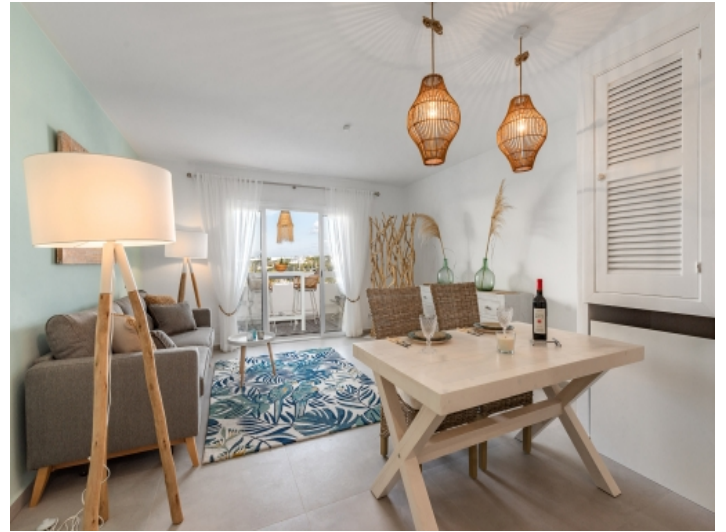
Wohnbereich mit Wohlfühl-Ambiente