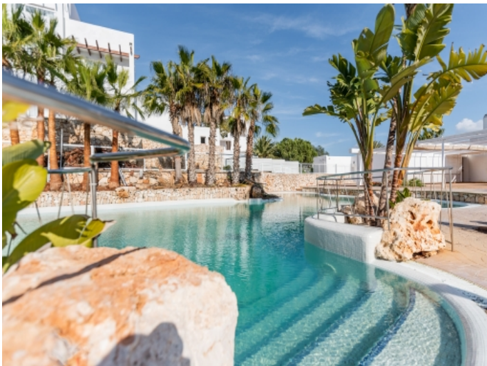
Schön angelegter Poolbereich