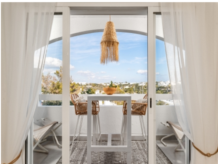
Zugang zum Balkon