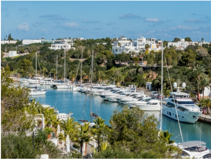
Beeindruckender Blick auf den Hafen