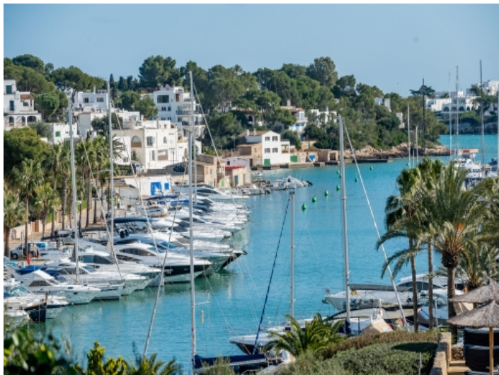
Meer- und Hafenblick