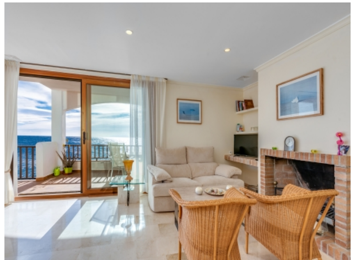
Meerblick-Wohnzimmer mit Kamin