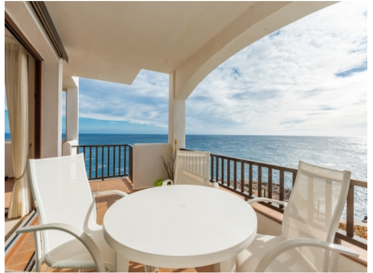
Terrasse mit Panorama-Meerblick