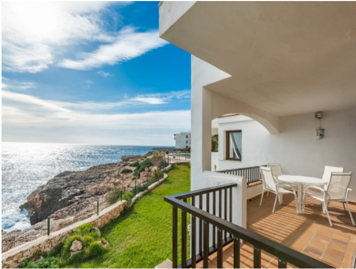
Atemberaubende Lage in erster Meereslinie