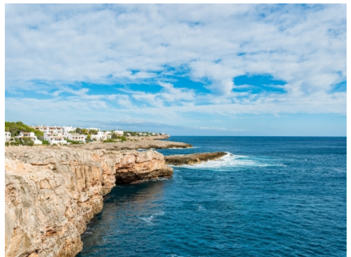
Blick auf die Küste