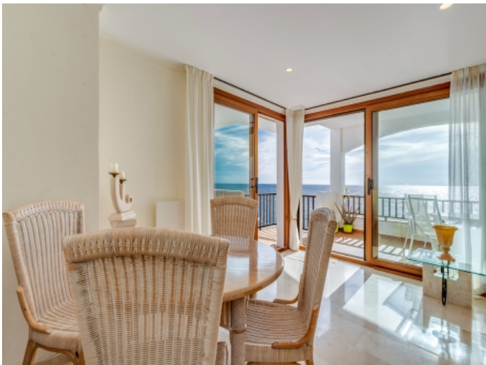
Essbereich mit Meerblick