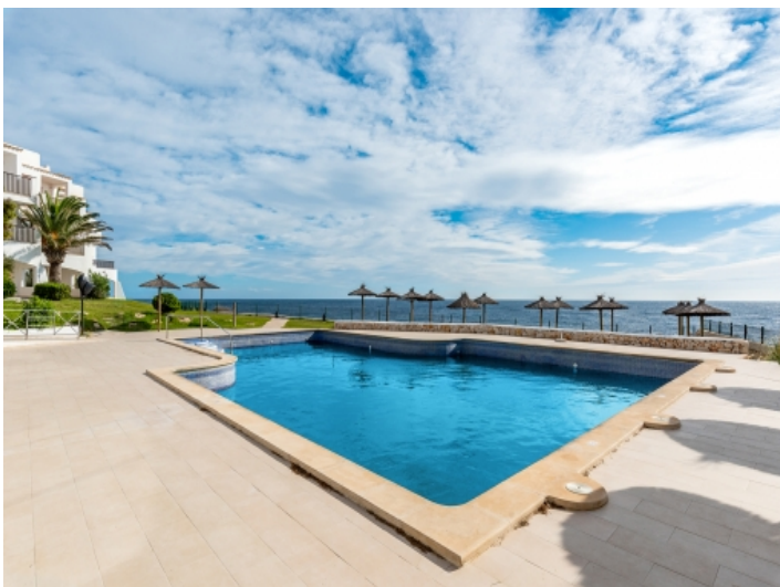
Pool in erster Meereslinie