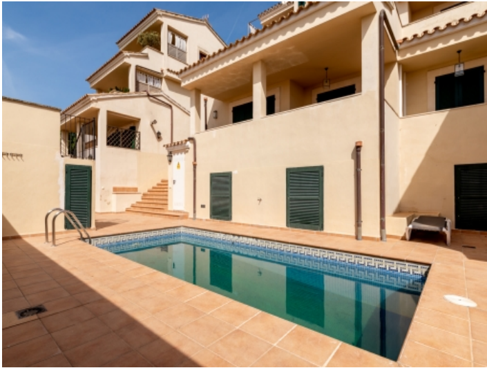
Ansicht des Komplexes mit Pool