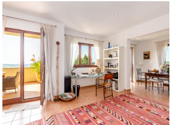
Heller, offener Wohn-und Essbereich