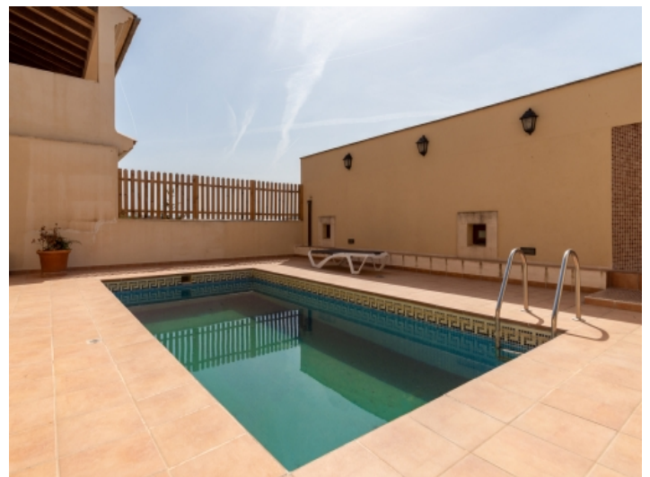
Gemeinschaftsbereich mit Pool