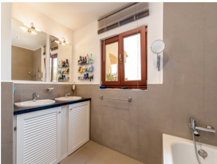
Eines von 2 Badezimmern