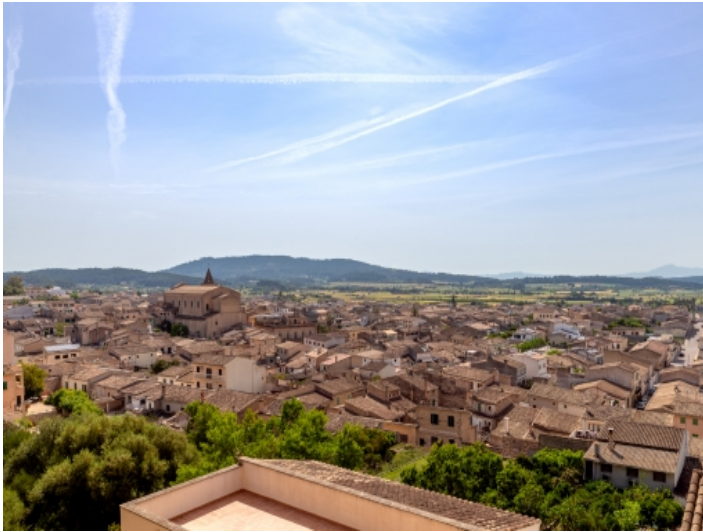
Toller Blick auf das schöne Dorf