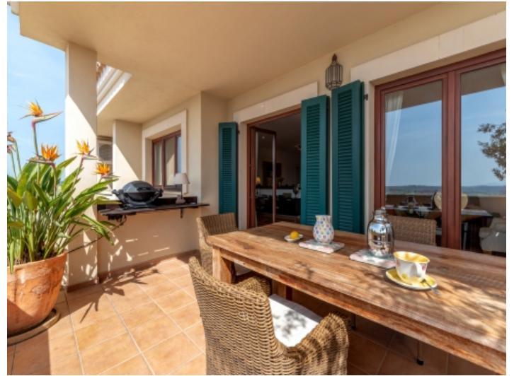
Überdachte Terrasse mit Ess- und Grillbereich