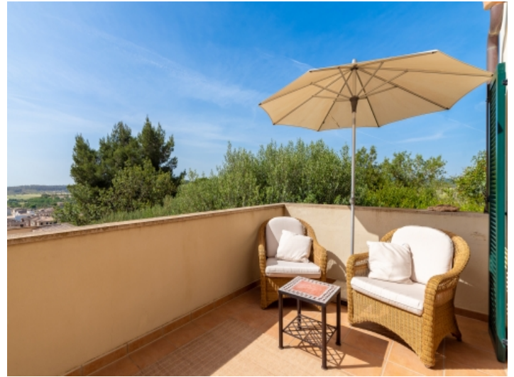
Herrliche Terrasse mit Sitzbereich