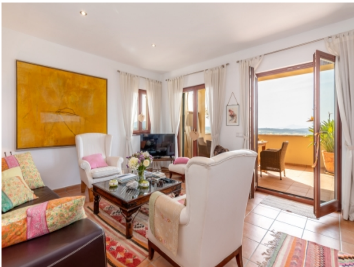
Komfortabler Wohnbereich mit Terrassenzugang