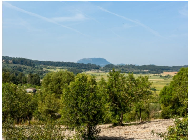
Freier Blick auf die umliegende Natur