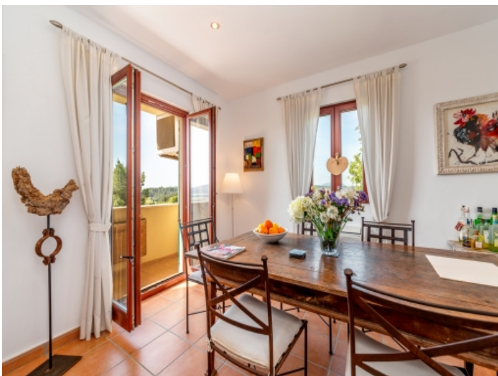
Schöner Essbereich mit Terrassenzugang