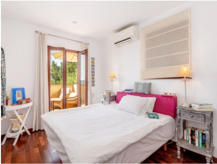
Doppelschlafzimmer mit Terrassenzugang