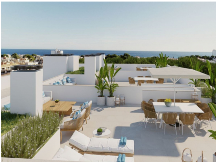
Wohnung mit Dachterrasse