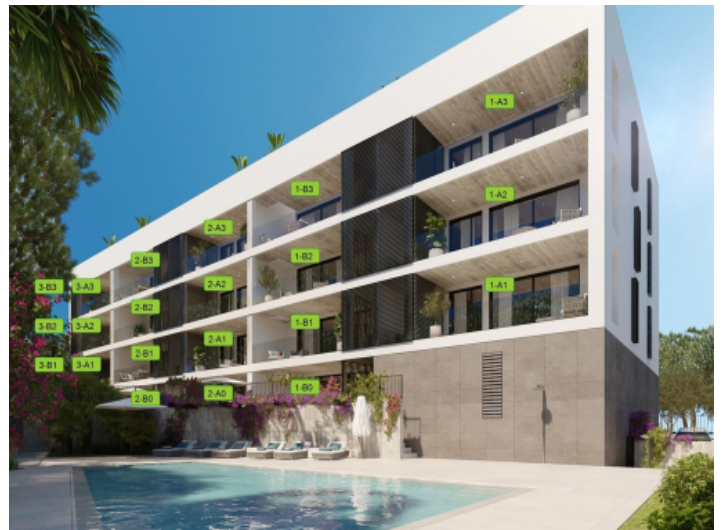
Wohngebäude mit 21 Wohnungen