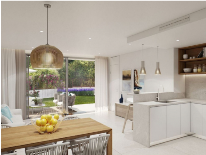
Essbereich und Küche