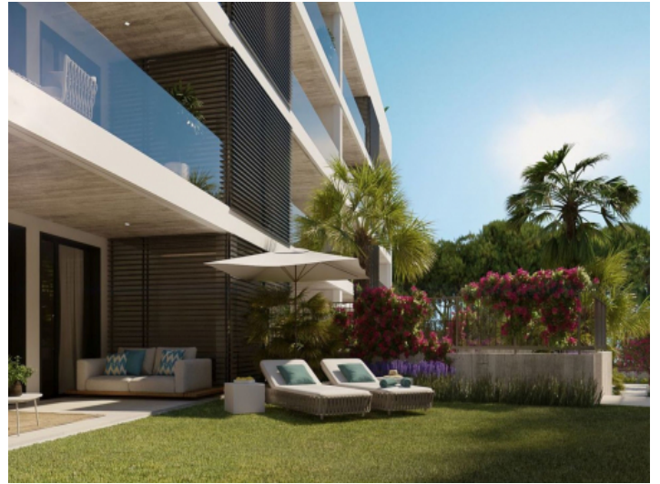
Apartment mit Garten