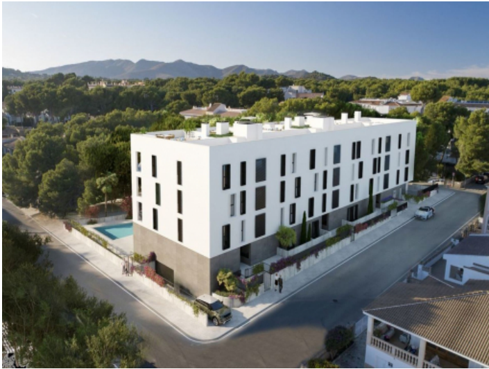
Ansicht auf das Gebäude