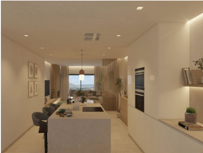
Offene, moderne Küche