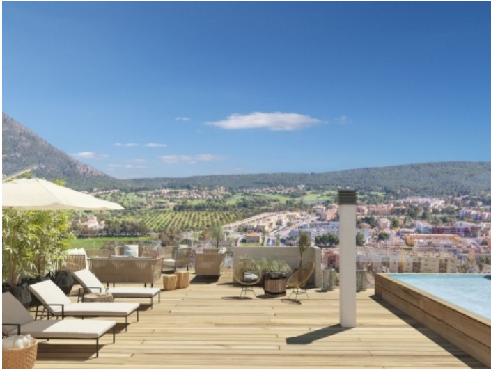
Terrasse mit Sonnenliegen