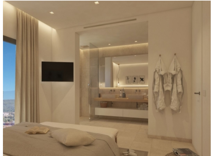
Schlafzimmer mit Badezimmer en Suite