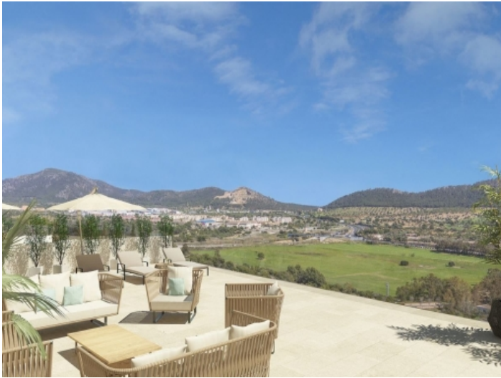
Sonnenterrasse mit Ausblick