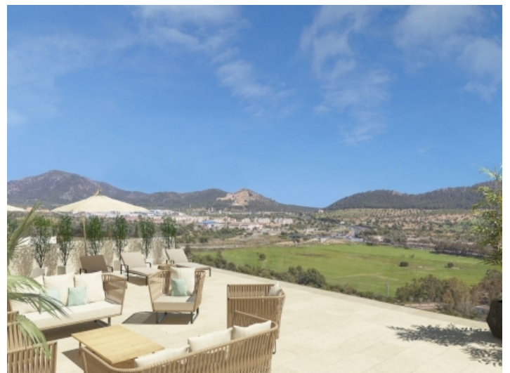
Sonnenterrasse mit Ausblick