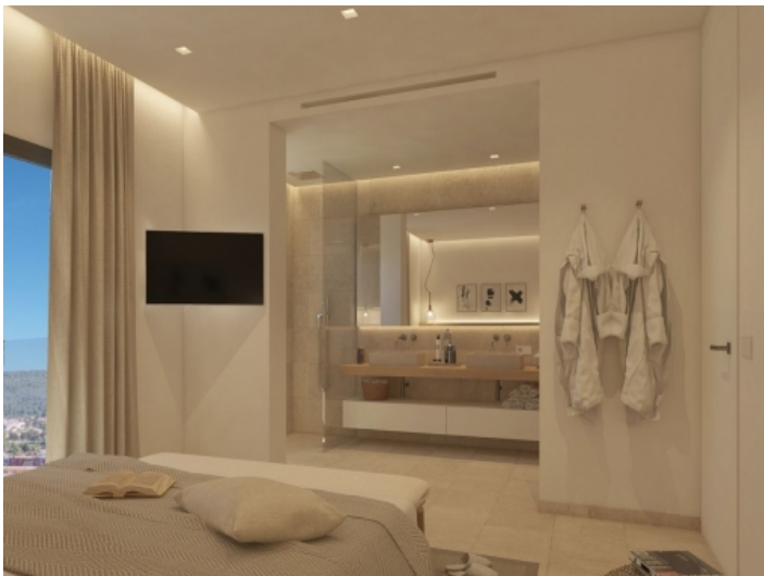
Schlafzimmer mit Badezimmer en Suite