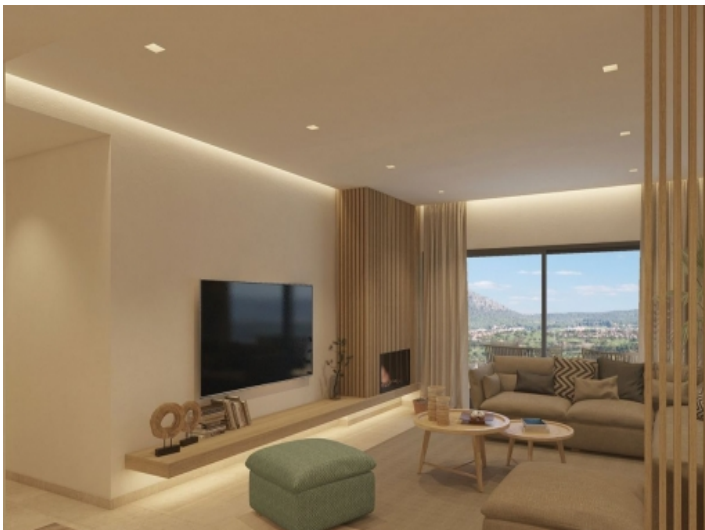
Wohnzimmer mit Aussicht