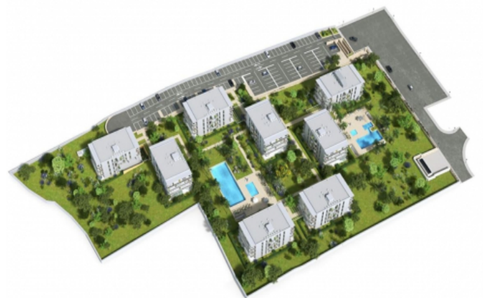
Übersicht der Anlage