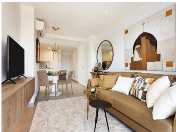
Wohnzimmer mit Blick zur Küche