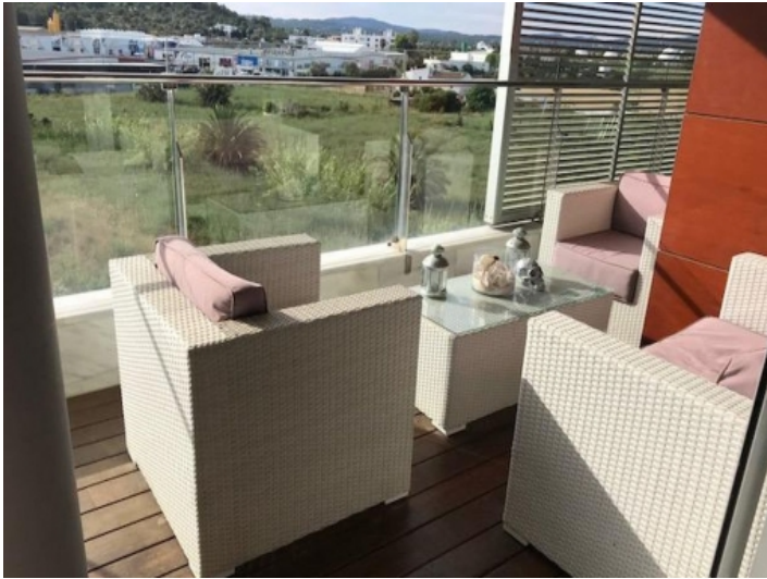
Sitzecke auf dem Balkon