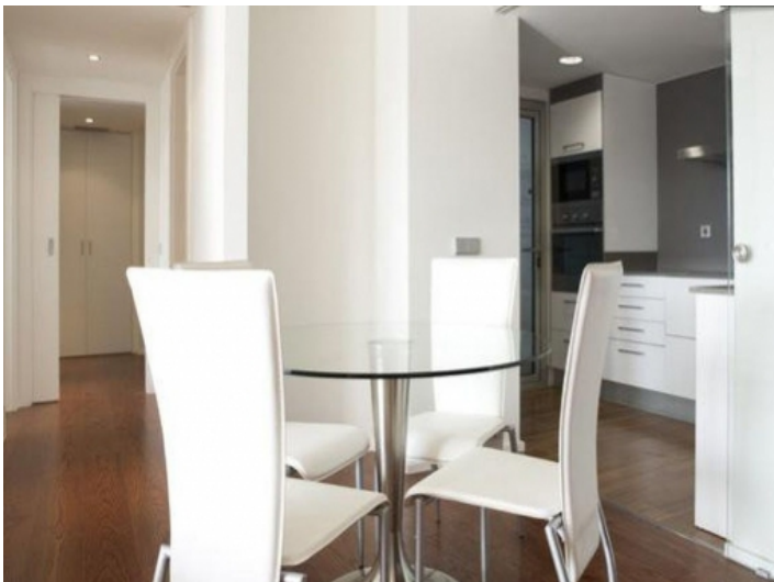
Essbereich und Küche