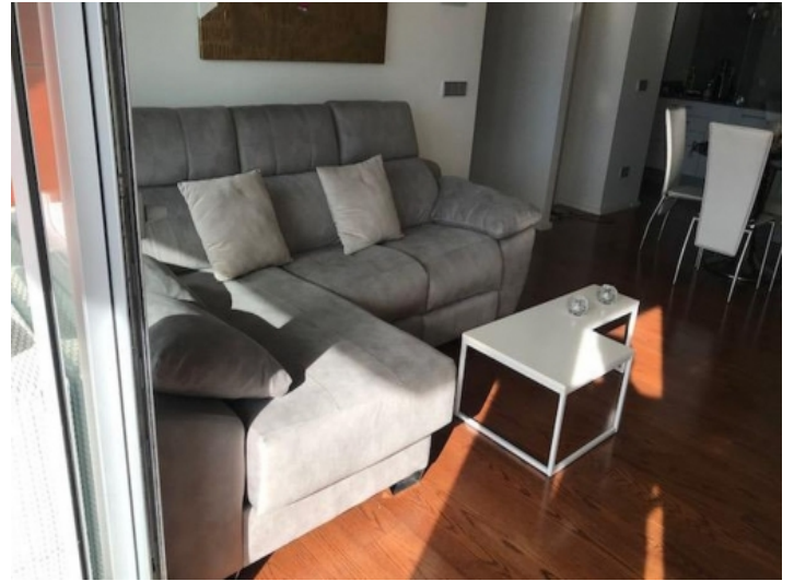
Offener Wohn- Essbereich