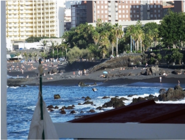
View from the livingroom