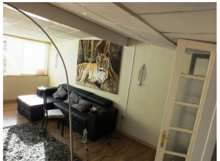
Comfortable seating in the living room