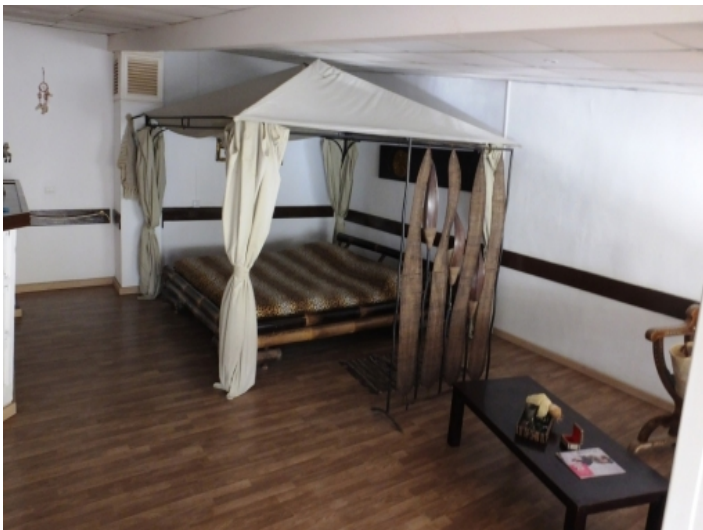
Bamboo canopy bed