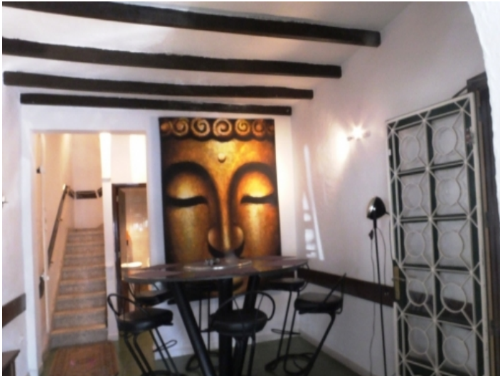
Charming sitting area