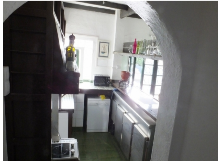
Fully equipped kitchen