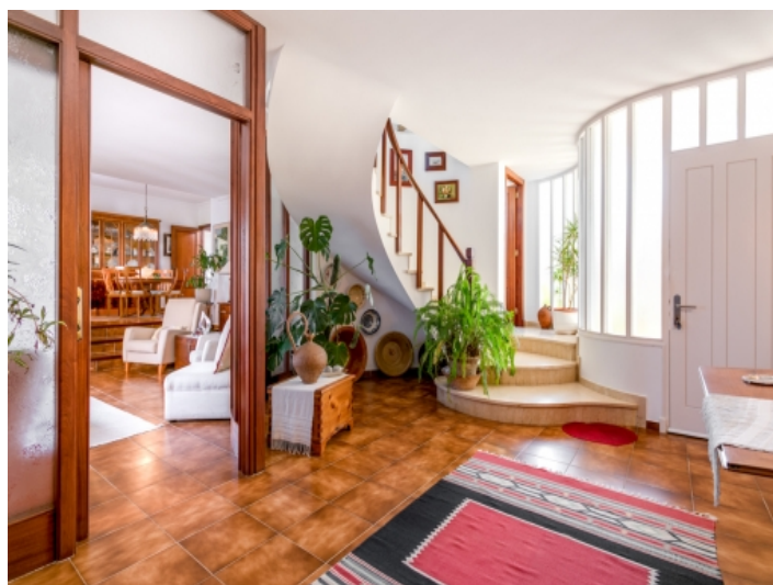
Offener Flurbereich und Treppenaufgang