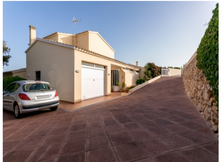
Außenbereich und Garage