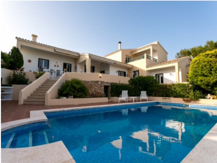
Wundervolle, große Villa mit Pool in La Mola