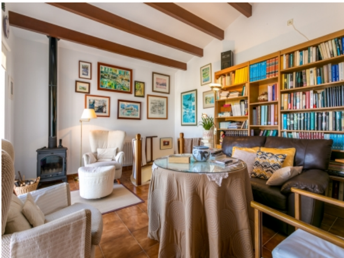
Weiterer Wohnbereich mit Ofen