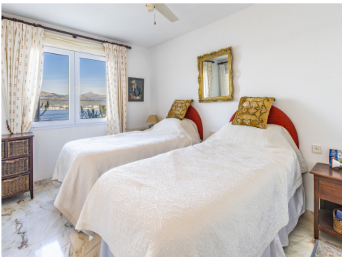
Das 2. Schlafzimmer