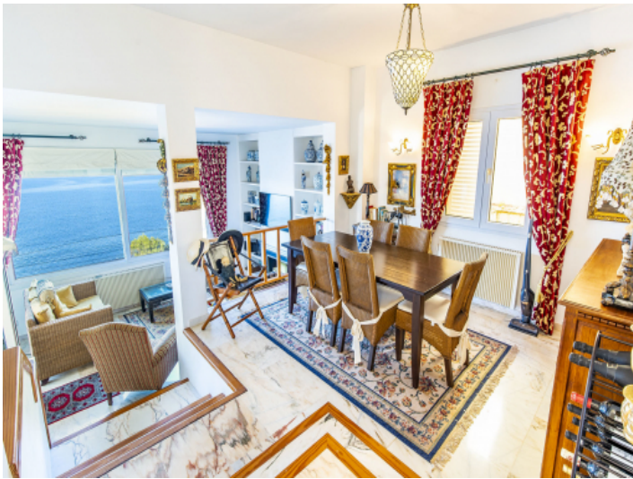
Heller Wohn- und Essbereich