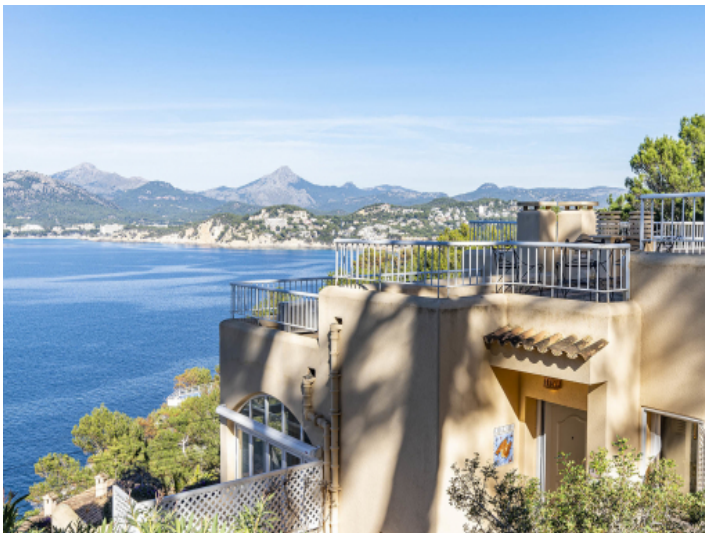
Ansicht auf die Wohnanlage