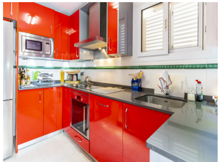
Voll ausgestattete Einbauküche