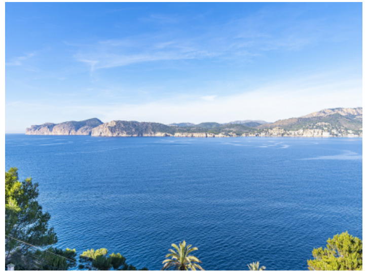
Traumaussicht auf das Mittelmeer