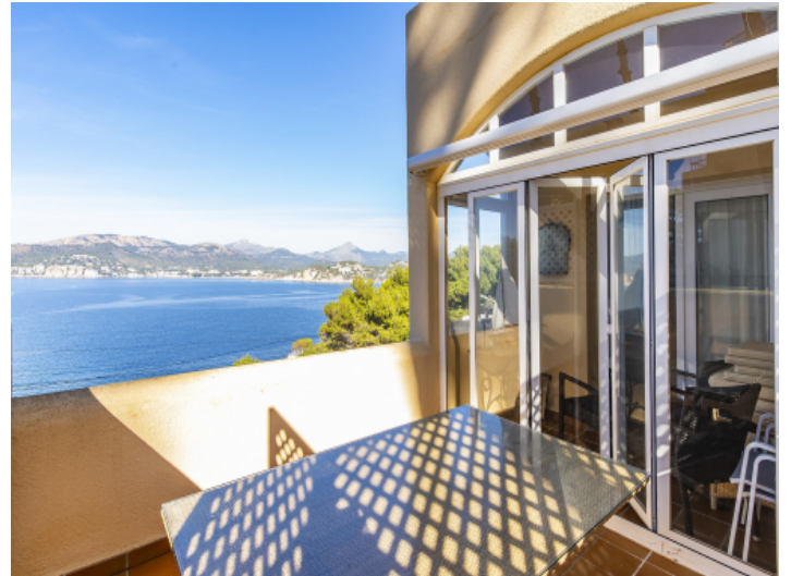
Terrasse mit Meerblick