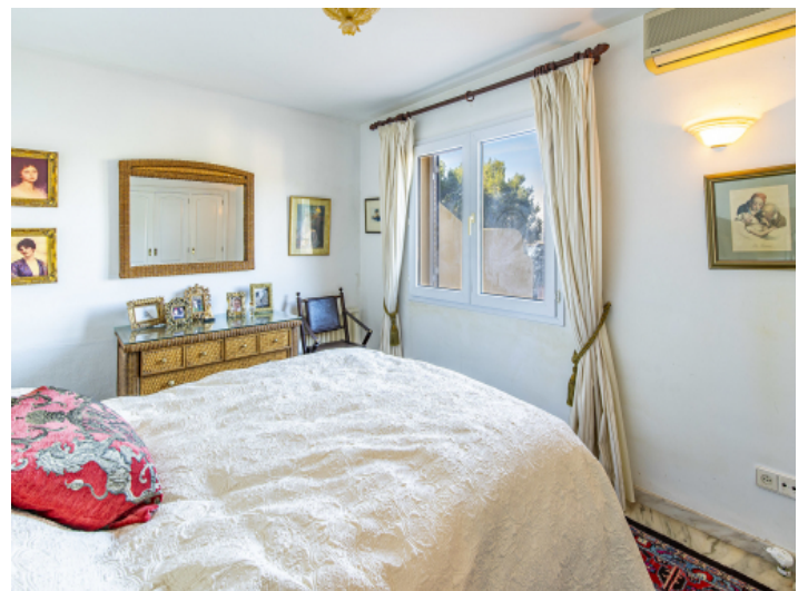
Schlafzimmer mit Badezimmer en Suite