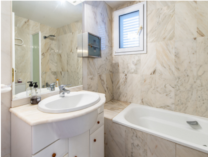
Badezimmer en Suite