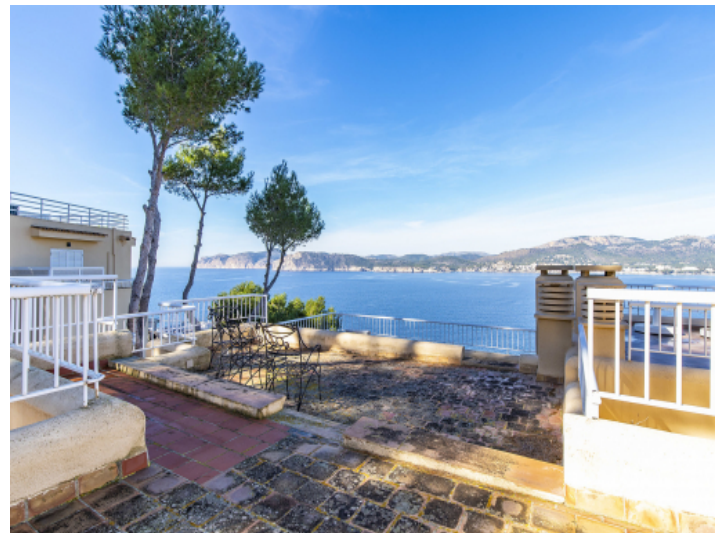
Dachterrasse mit frontalem Meerblick