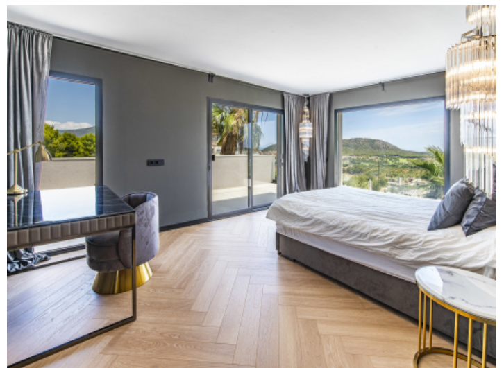
Schlafzimmer mit direktem Balkonzugang