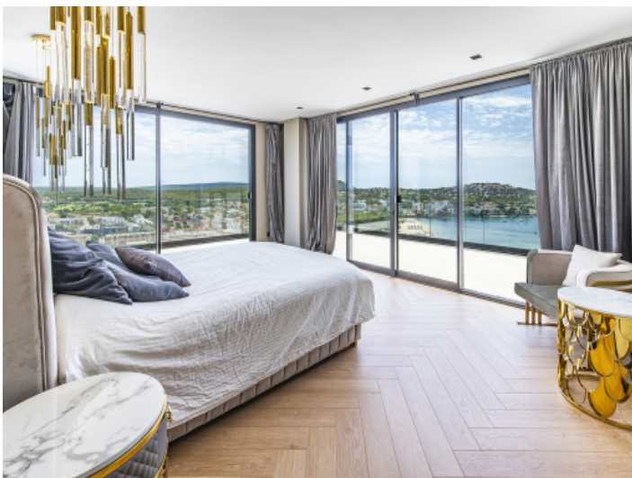
Schlafzimmer mit bodentiefen Fenstern