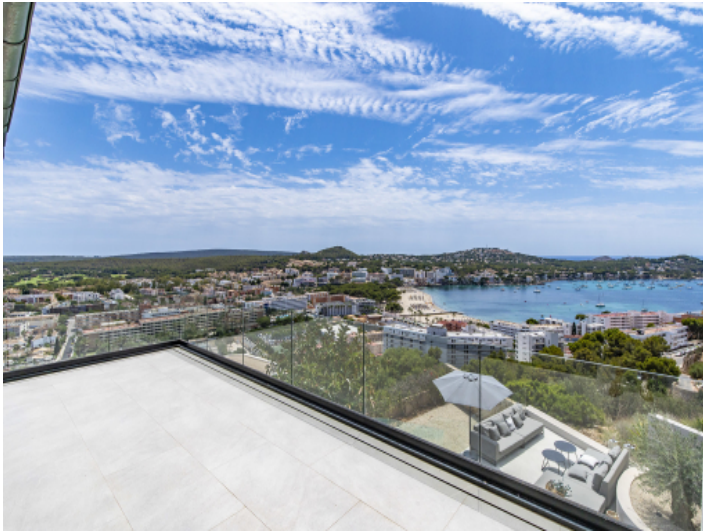
Balkon mit Meerblick