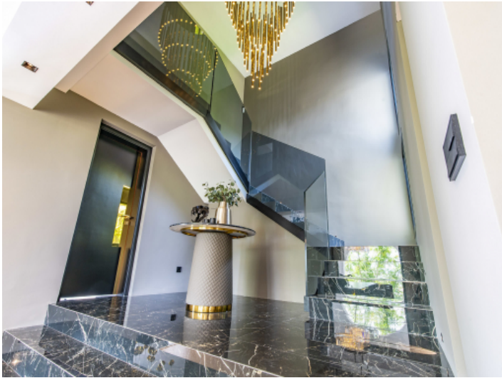
Eingangshalle der Villa