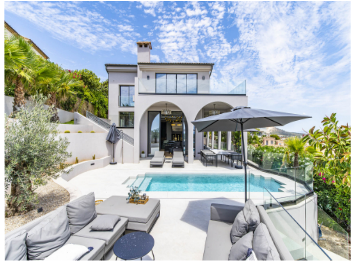
Terrasse mit Loungebereich