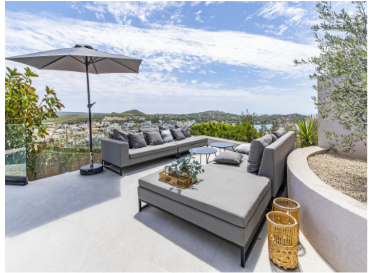
Loungebereich der Terrasse