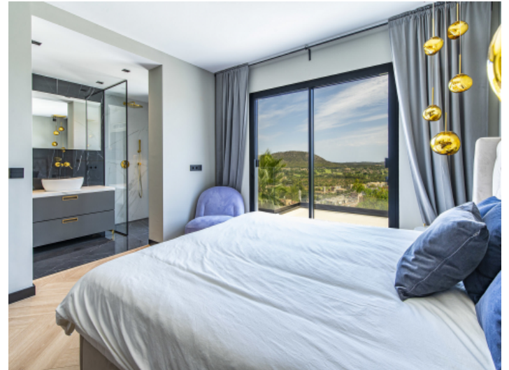
Schlafzimmer mit Badezimmer en suite