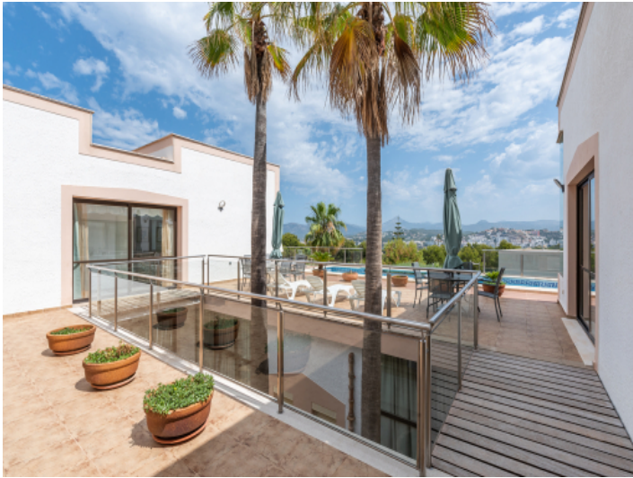
Terrasse und Patio