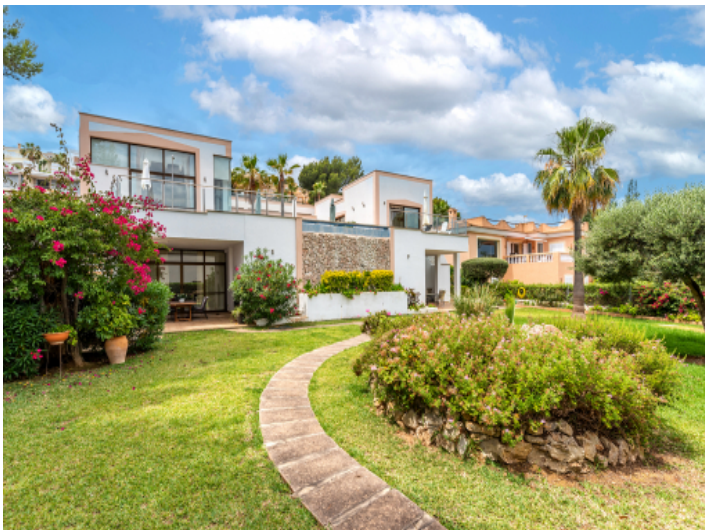
Außenansicht und Garten