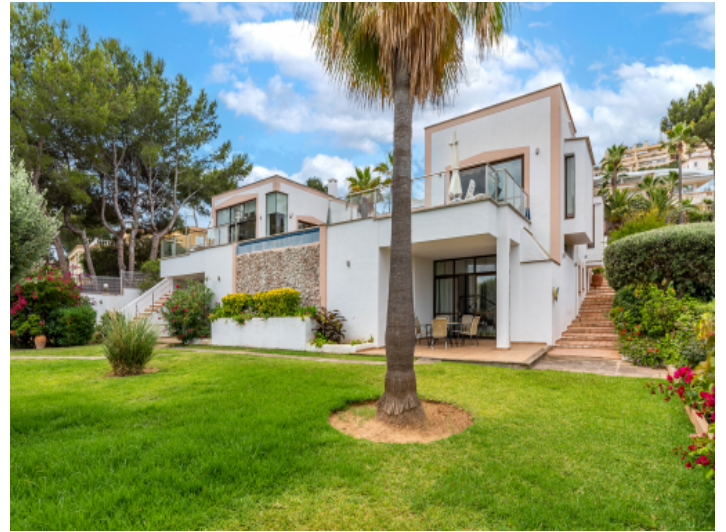
Garten und Außenansicht