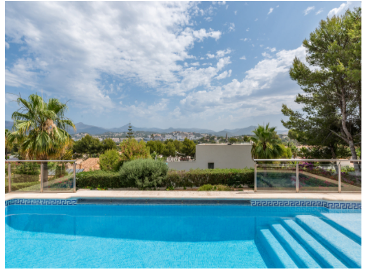
Pool mit Weitblick