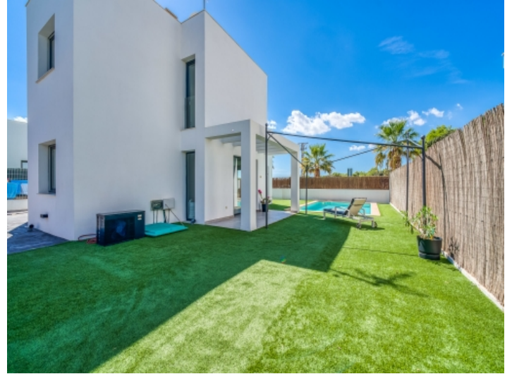
Außenbereich mit viel Platz