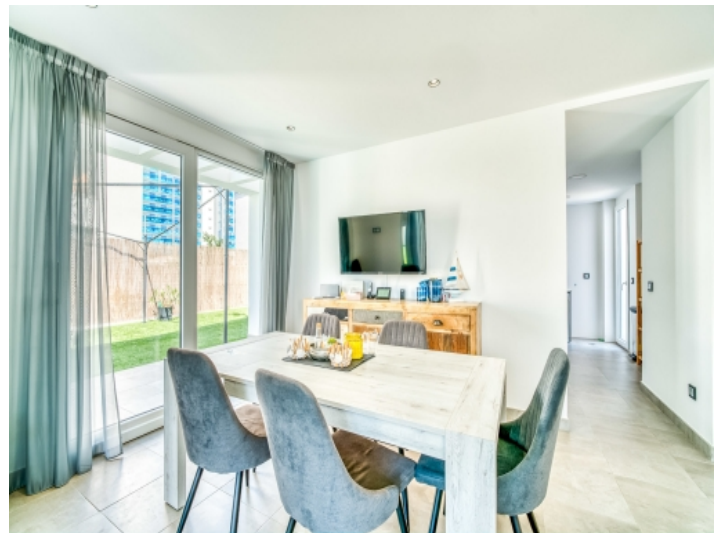
Essbereich mit Terrassenzugang