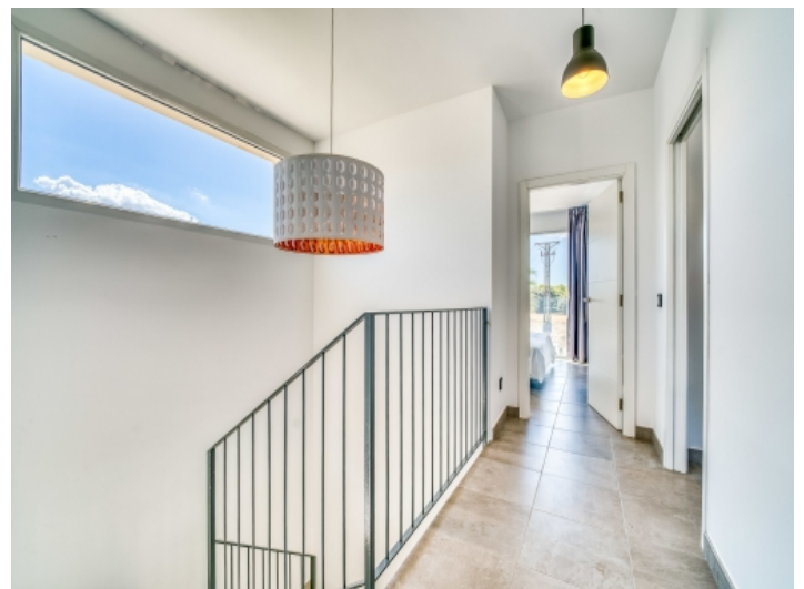
Flur im Obergeschoss