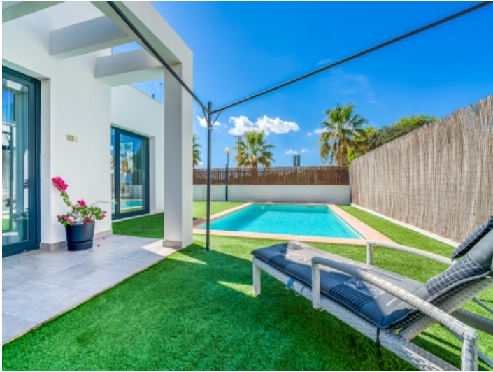
Wundervoller Pool- und Terrassenbereich