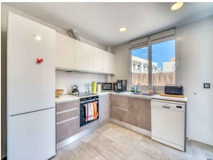
Moderne, helle Küche