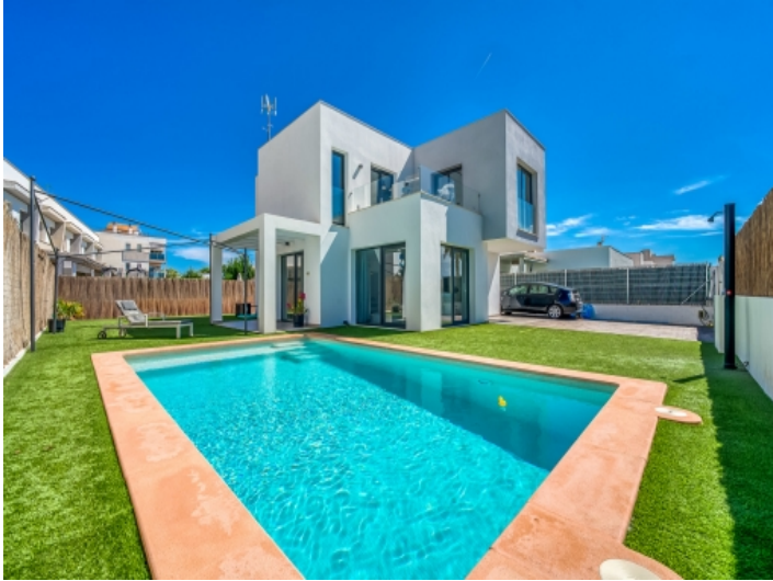
Sonniger Pool für Sommertage