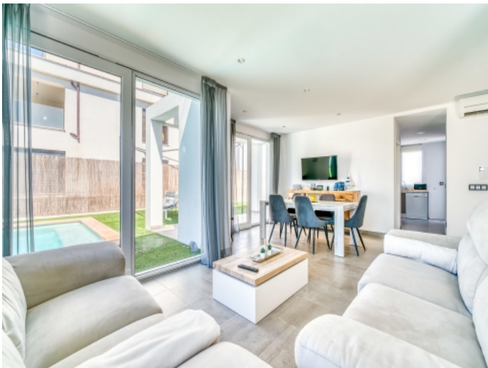
Moderner Wohn-und Essbereich