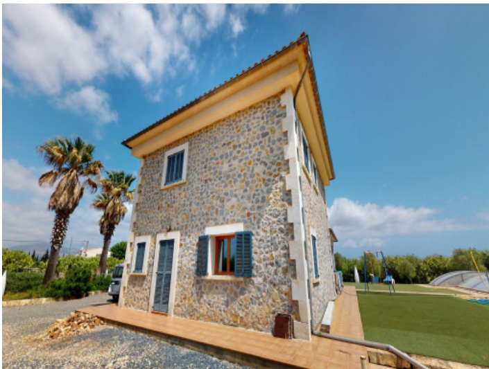
Außenansicht der Finca