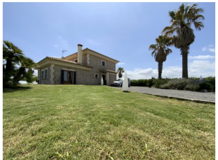
Finca und Garten