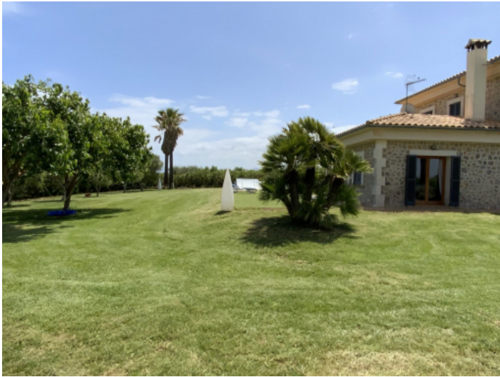
Finca und Garten