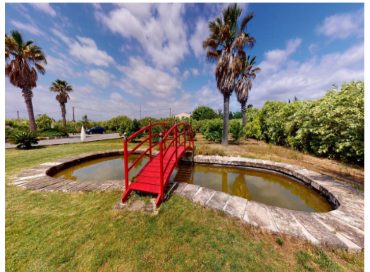
Naturpool im Garten