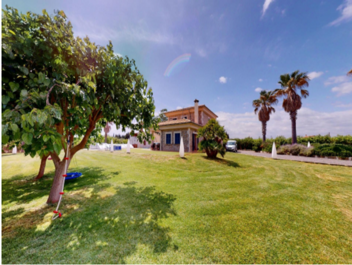
Natursteinfinca mit Pool und Obstplantage unweit von der