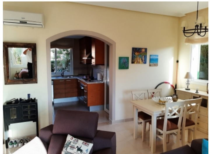
Blick zur Küche