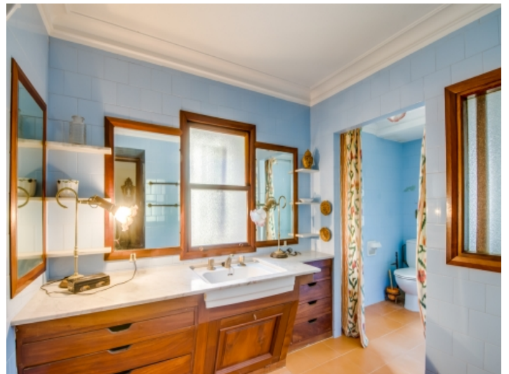
Eines von 9 Badezimmern