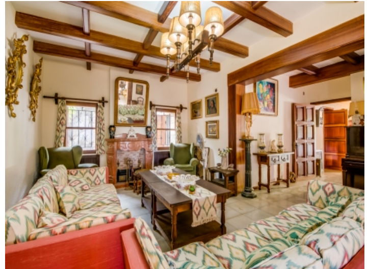
Weiterer Wohnbereich mit Holzbalken