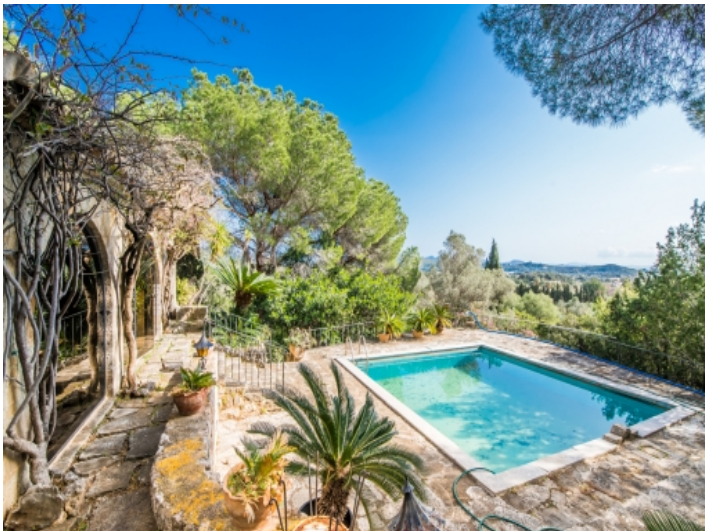
Poolbereich privat gelegen mit Weitblick