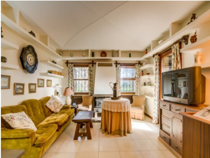
Rustikaler Wohnbereich mit Terrassenzugang