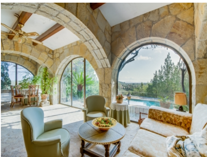
Lichtdurchfluteter Wintergarten mit Ausblick