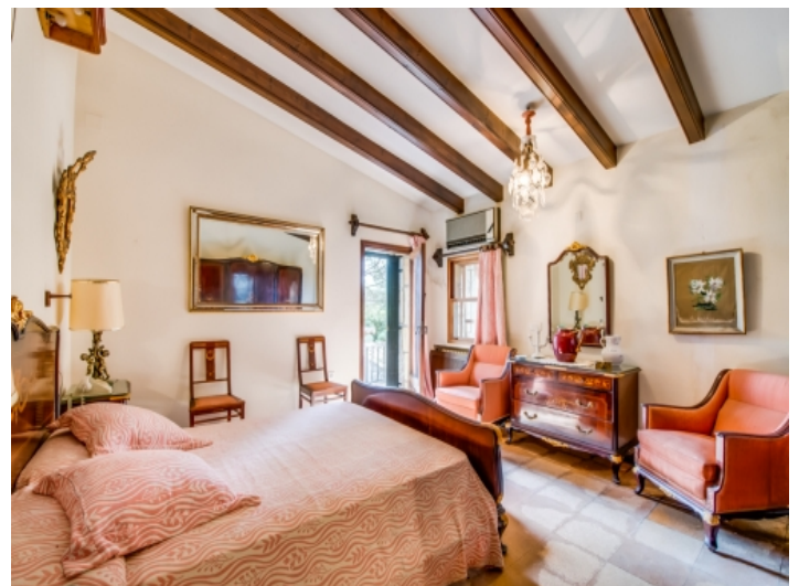
Eines von 11 Schlafzimmern