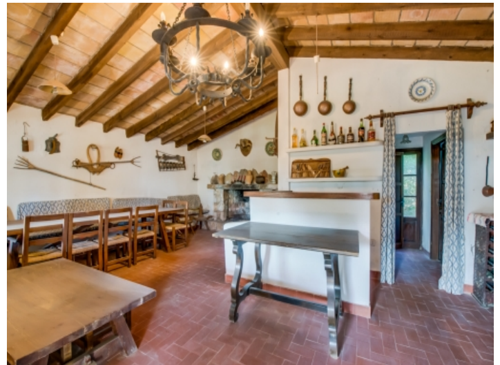
Rustikales BBQ Haus mit Holzbalken