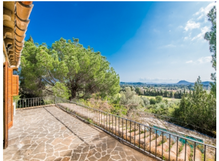
Beeindruckender Panoramablick von der Terrasse aus