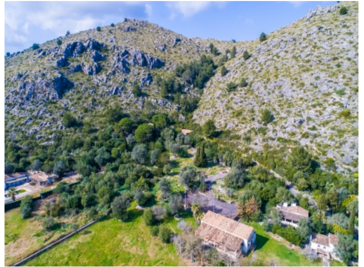
Blick auf das Anwesen mit Tennisplatz