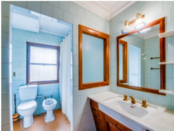
Eines von 9 Badezimmern