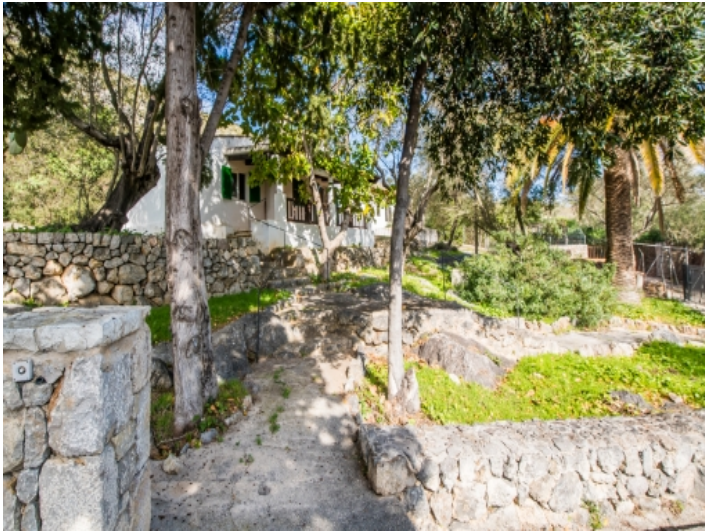
Zugang zu den Gästehäusern