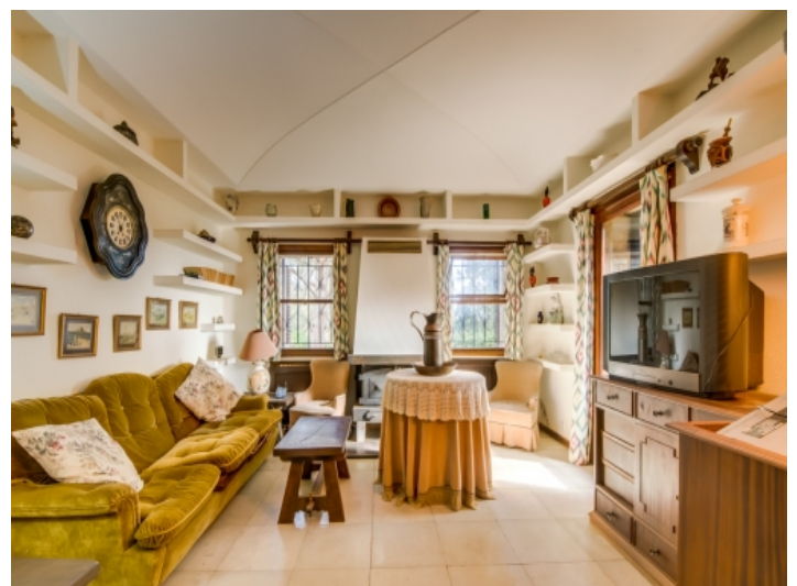
Rustikaler Wohnbereich mit Terrassenzugang