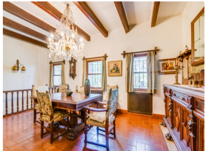
Essbereich im Obergeschoss