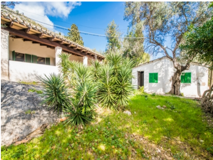
Ansicht der Gästehäuser