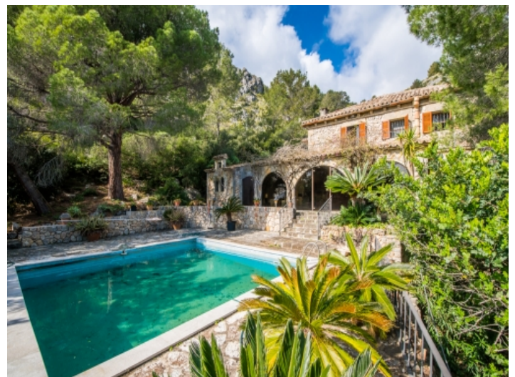
Pool inmitten von Natur