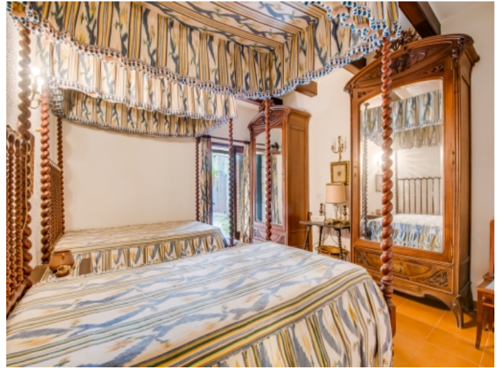
Eines von 11 Schlafzimmern