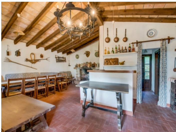
Rustikales BBQ Haus mit Holzbalken