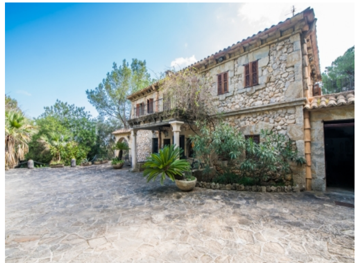
Frontansicht des Hauotheses