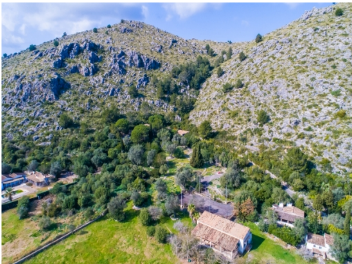
Blick auf das Anwesen mit Tennisplatz