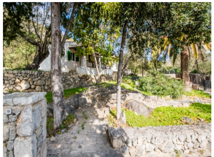
Zugang zu den Gästehäusern