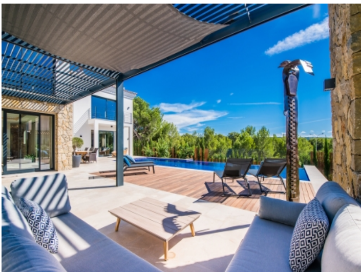
Überdachte Chill-Out Lounge