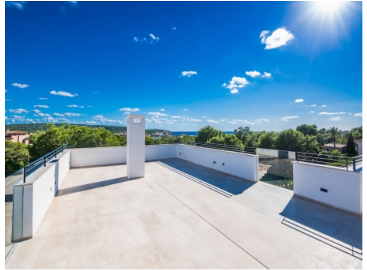
Großflächige Dachterrasse mit Weitblick