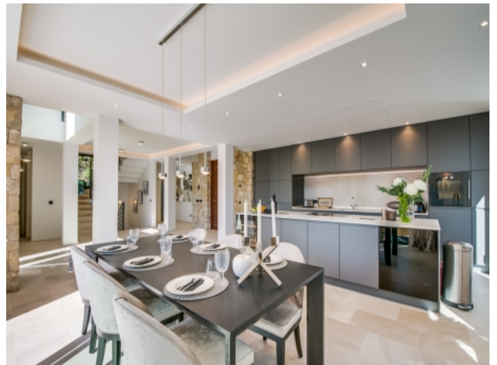
Moderne Küche mit Essbereich