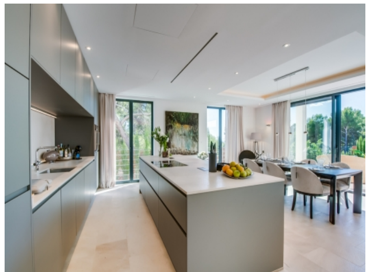
Luxuriöse, offene Küche