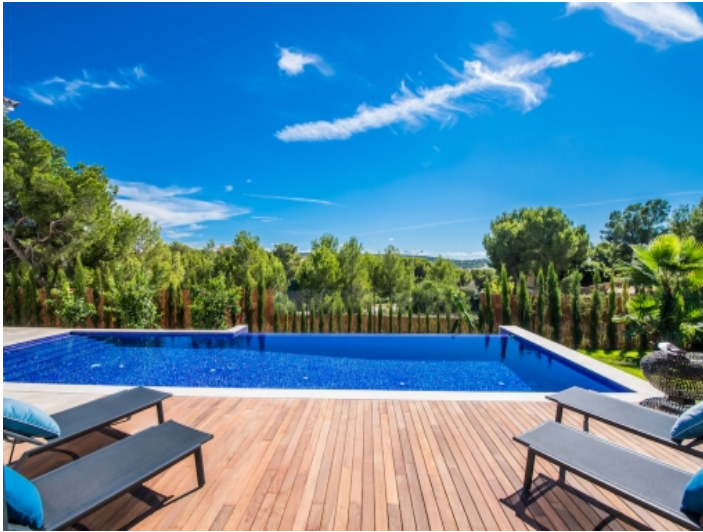
Sonnige Terrasse mit Sonnenliegen