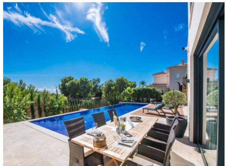
Sitzbereich auf der Terrasse