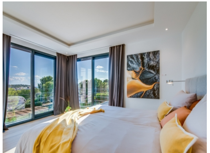
Schlafzimmer mit Weitblick