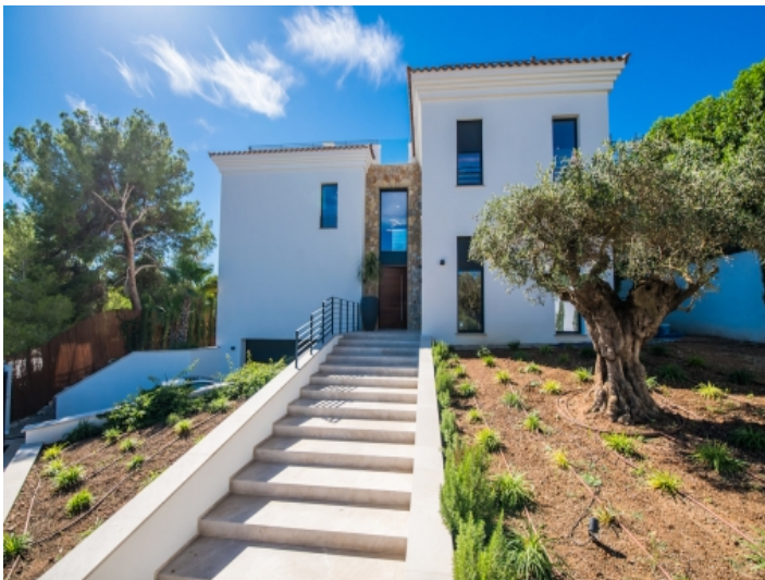
Frontansicht und Zugang