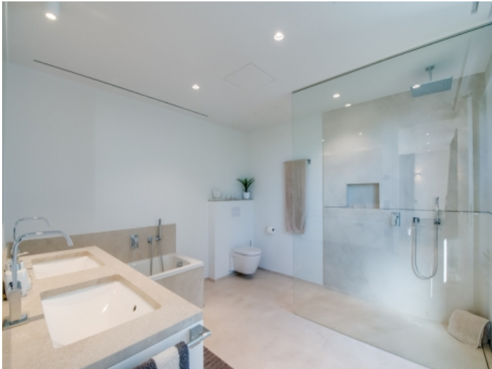
Nobles Badezimmer mit Badewanne und Dusche