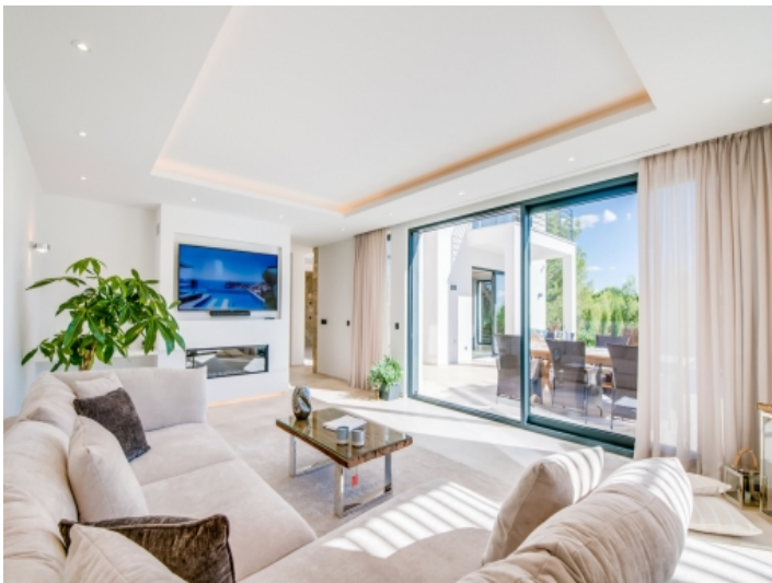
Alternative Ansicht des Wohnbereichs