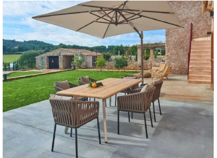
Terrasse mit schönem Essbereich