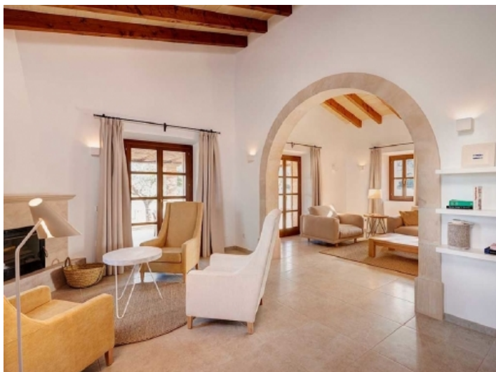
Kaminecke mit Steinbogen