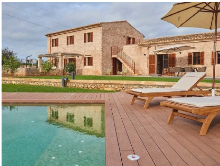
Herrlicher, privater Pool