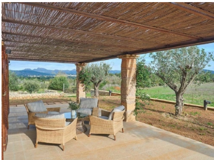
Große, überdachte Terrasse