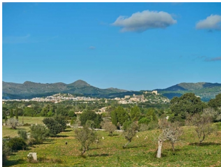
Beeindruckender Blick auf Artá