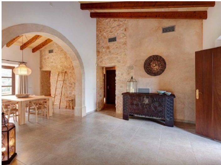
Eingang und Essbereich mit Steinwand