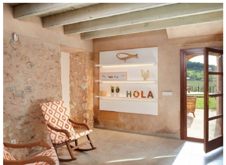
Zugang zur Terrasse