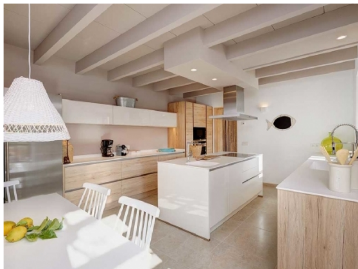
Moderne Küche mit Essbereich