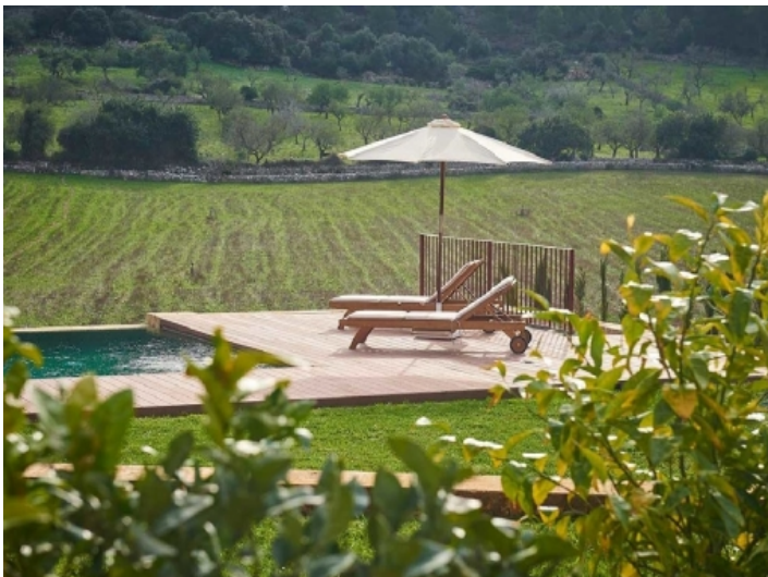
Pool umgeben von Natur