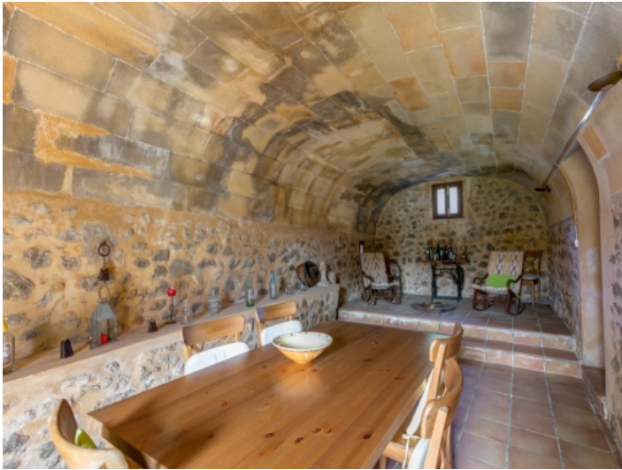
Traditioneller Essbereich mit Gewölbedecke