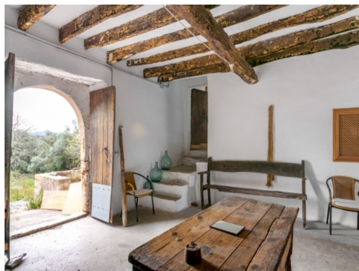
Bezaubernder Zugang zum Gebäude