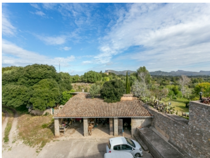
Idyllischer Ausblick über die Landschaft