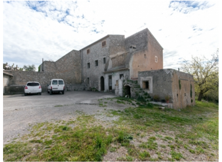
Außenansicht des Anwesens