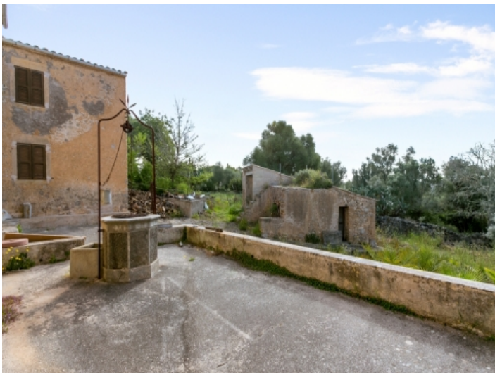
Eine von zahlreichen Terrassen