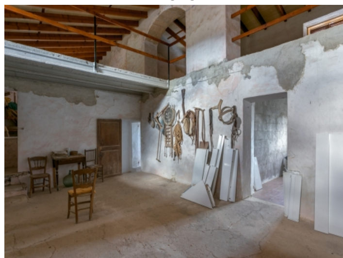
Beeindruckender Innenbereich mit hoher Decke