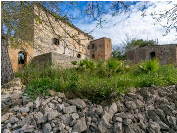
Umgeben von einer idyllischen Landschaft