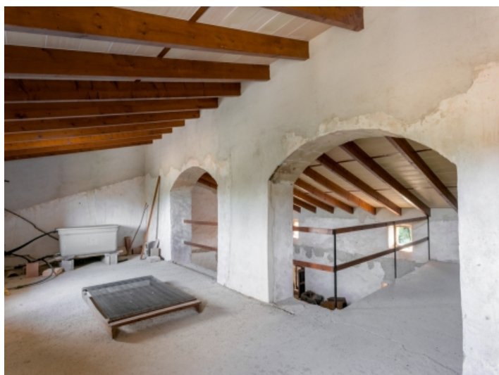
Das Anwesen bietet viel Potential