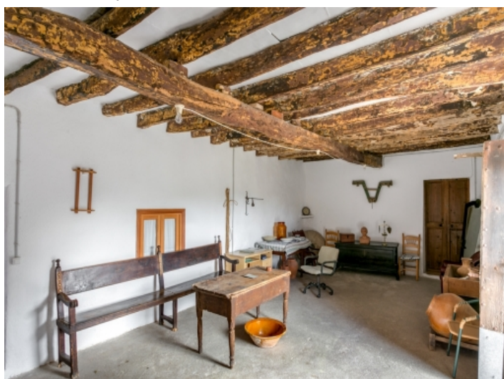
Raum mit Holzdeckenbalken