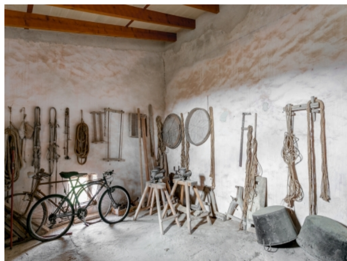
Einer von 10 Räumen