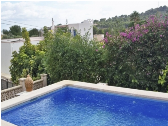
Pool des Hauses