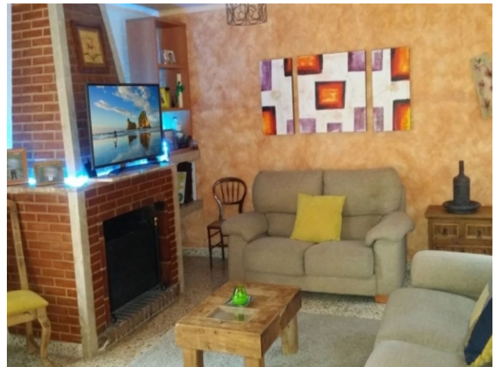
Wohnbereich des oberen Apartments