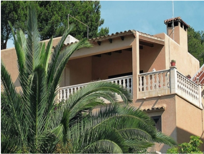
Außenansicht des Hauses