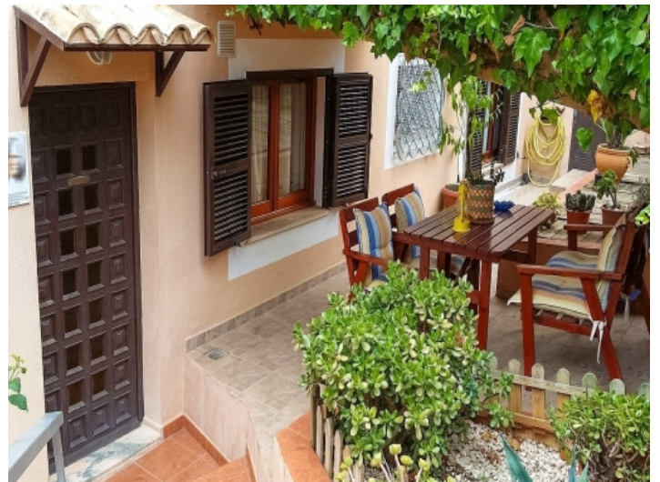
Eingangsbereich und Terrasse