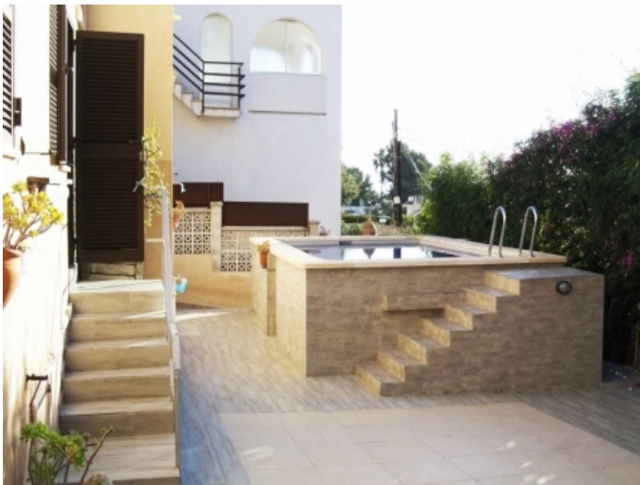
Pool des Apartments