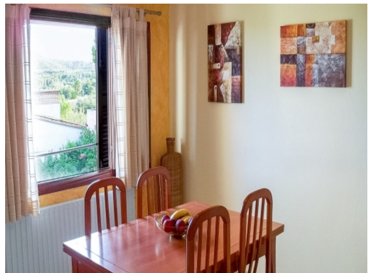
Ansicht des Essbereichs