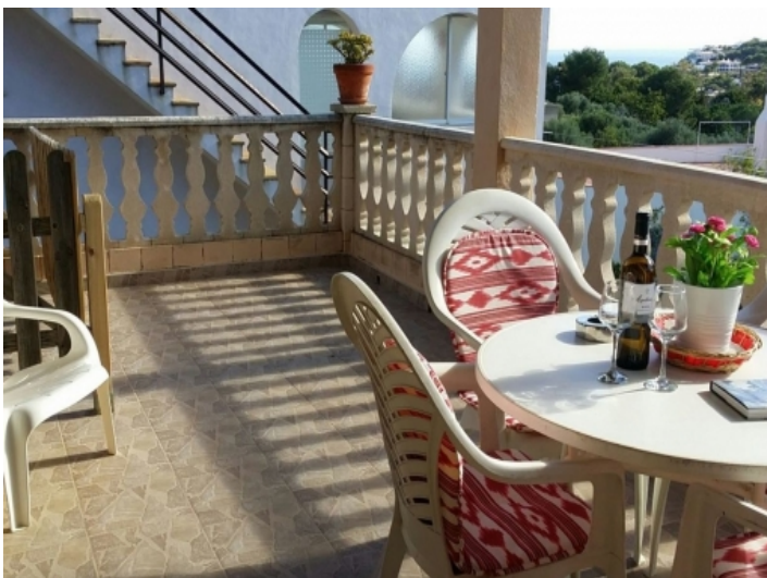
Terrasse mit Meerblick