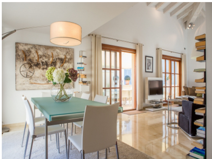
Esszimmer neben dem Wohnbereich