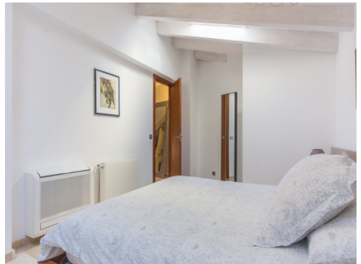
Eins von drei Schlafzimmern