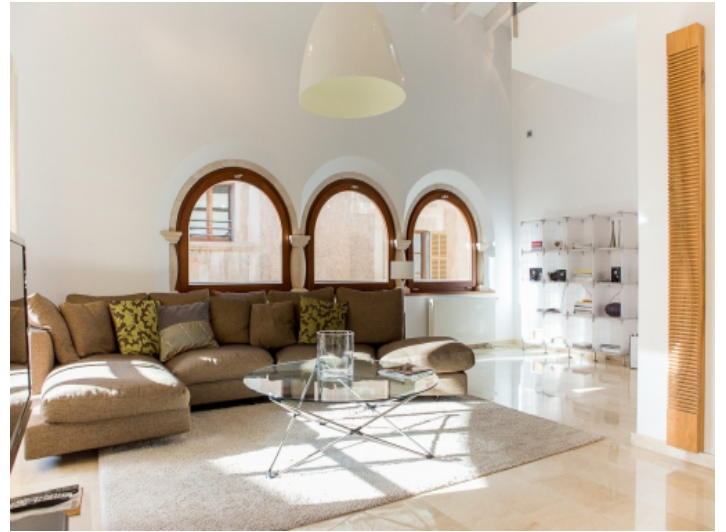
Alternative Ansicht vom Wohnzimmer