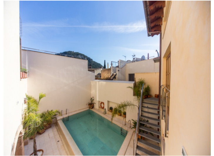
Views of the pool area