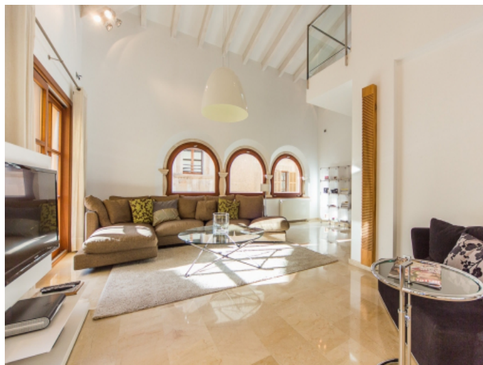
Gemütliches Wohnzimmer mit originalen Bogenfenstern