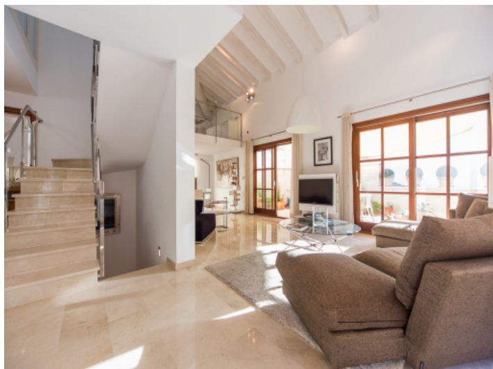
Offener und weitläufiger Wohnbereich