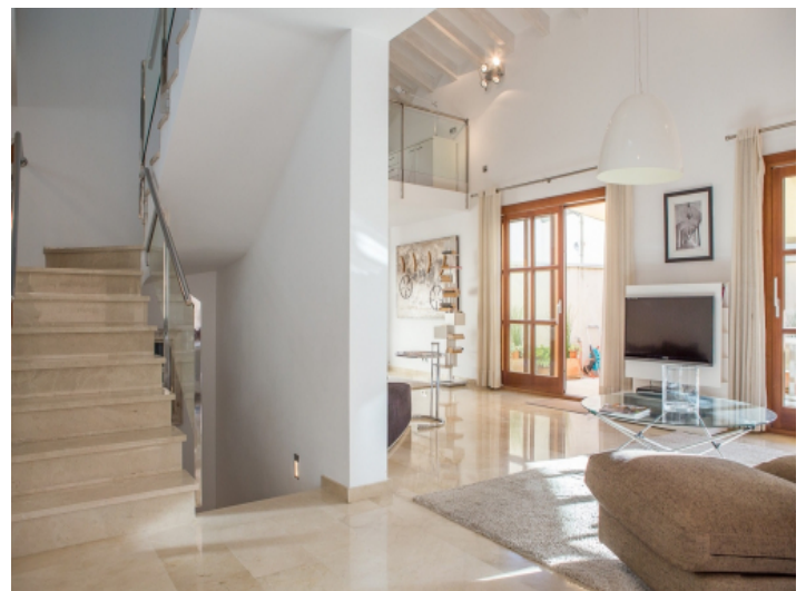
Zugang zur oberen Etage