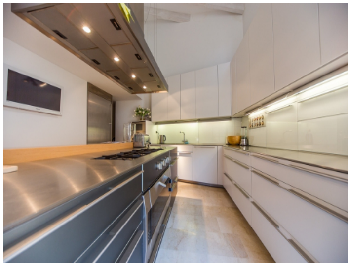
Voll ausgestattete Küche