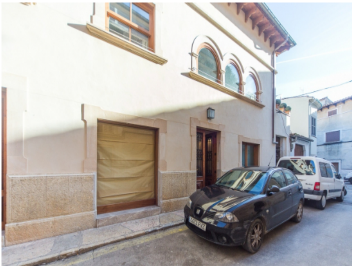
Exterior view of the building