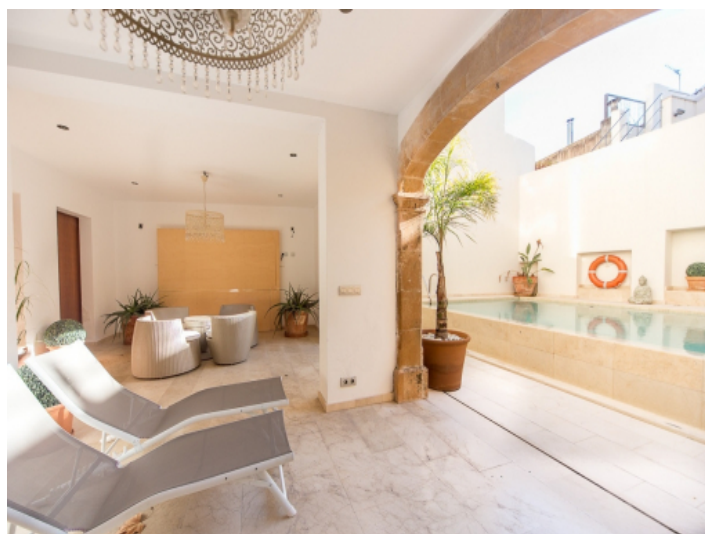
Überdachte Terrasse mit Loungebereich