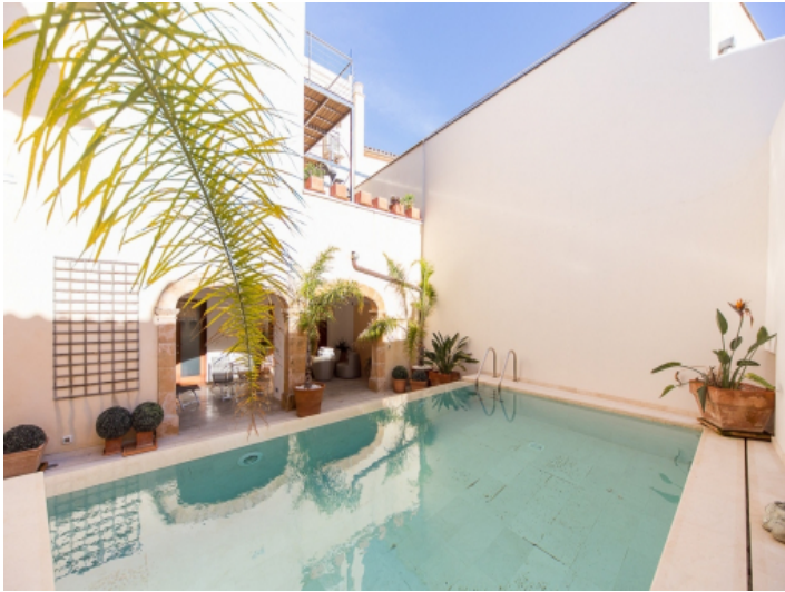
Traumhafter Patio mit Pool