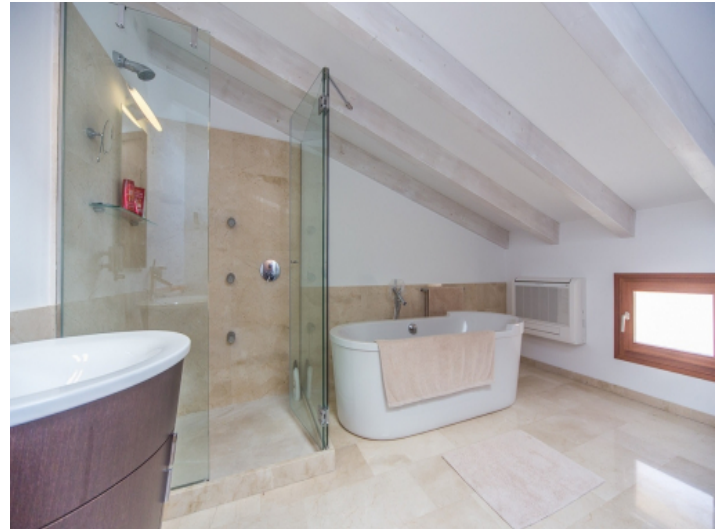
Hauptbadezimmer mit Badewanne und Dusche