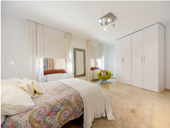
Sehr großzügiges und schönes Hauptschlafzimmer