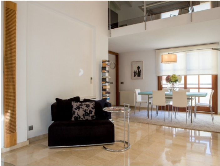
Eingangsbereich vom Wohnzimmer