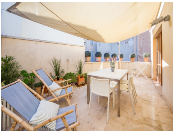
Fantastische Sitzecke auf der Terrasse