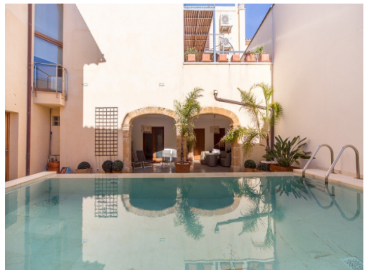
Exklusives Anwesen mit Pool