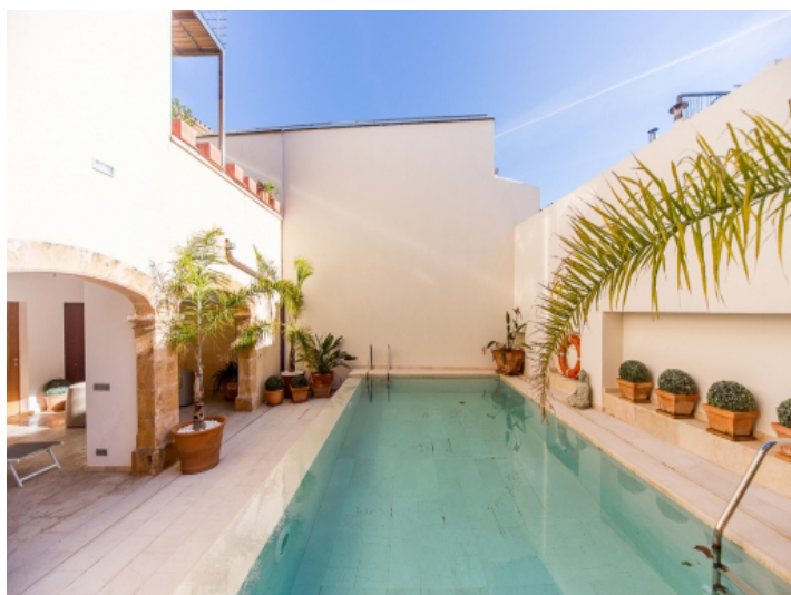
Einladender Poolbereich, umgeben von Terrassen