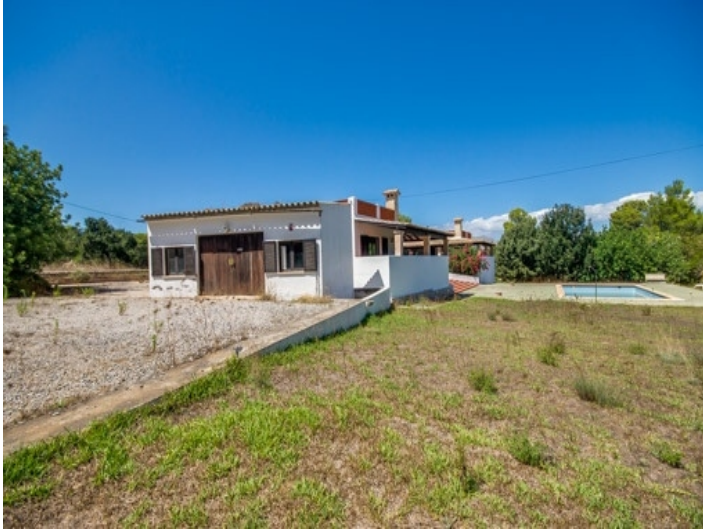
Mediterraner Garten neben der Poolanlage