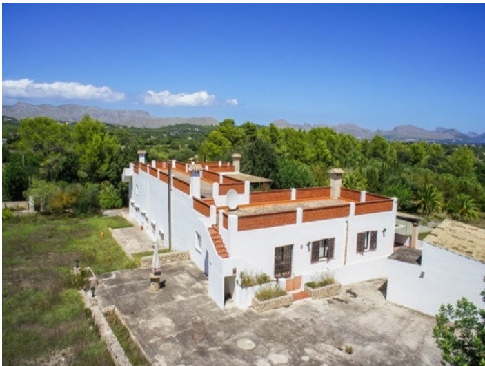
Großzügiges Anwesen mit wundervollem Bergblick