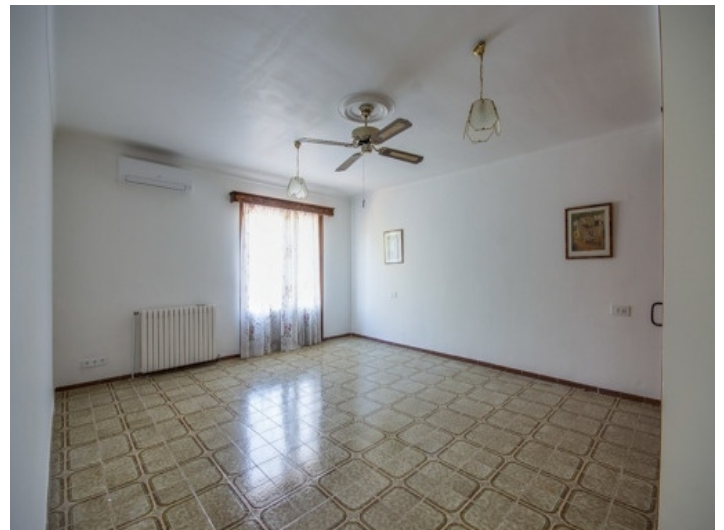
Kleines Schlafzimmer mit hohen Fenstern und Heizung