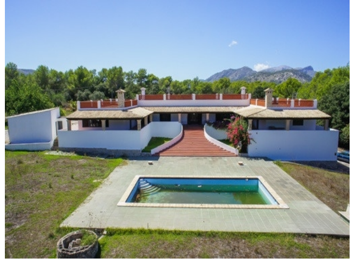
Der Swimmingpool ist von einer Terrasse umgeben