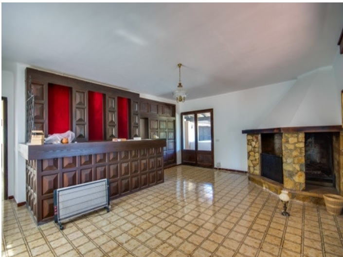
Originelle Bar mit Kamin