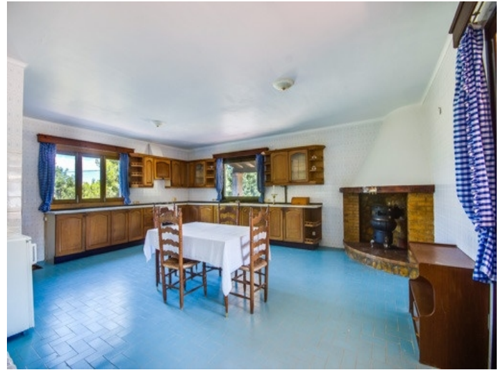
Lichtdurchflutete Küche mit rustikaler Möblierung