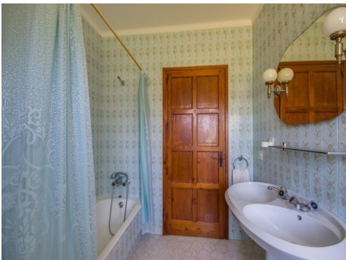
Uriges Badezimmer mit Badewanne