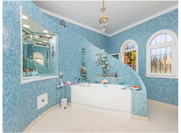
Tageslichtbadezimmer mit Badewanne