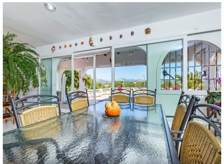
Essbereich mit direktem Terrassenzugang