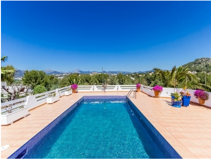
Einmaliges Landschaftspanorama vom Poolbereich