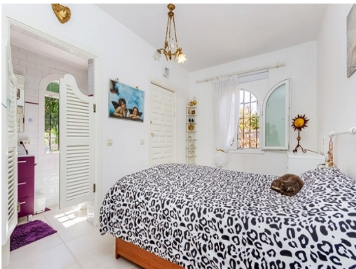
Schlafzimmer mit Balkonzugang