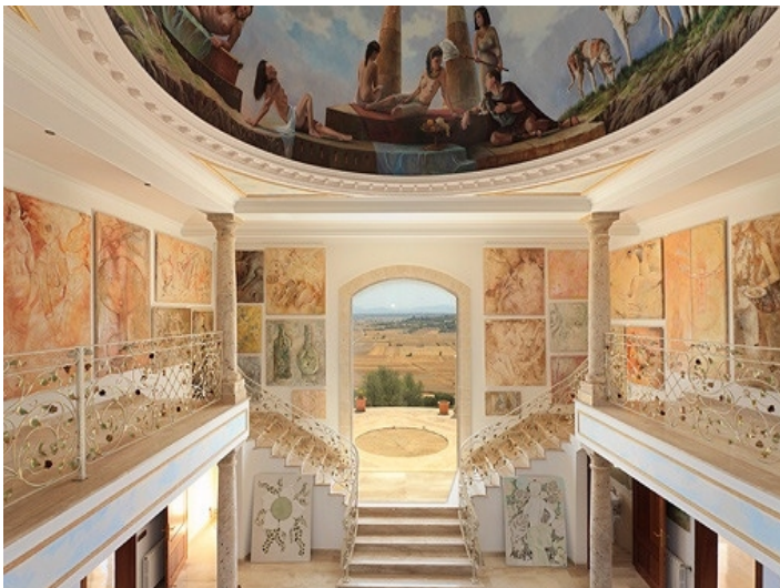
Beeindruckendes Kuppel-Fresko über dem Eingangsbereich