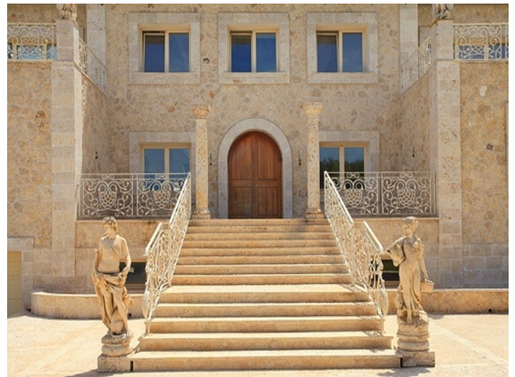
Prunkvolle, mehrstufige Treppe zum Eingangsbereich