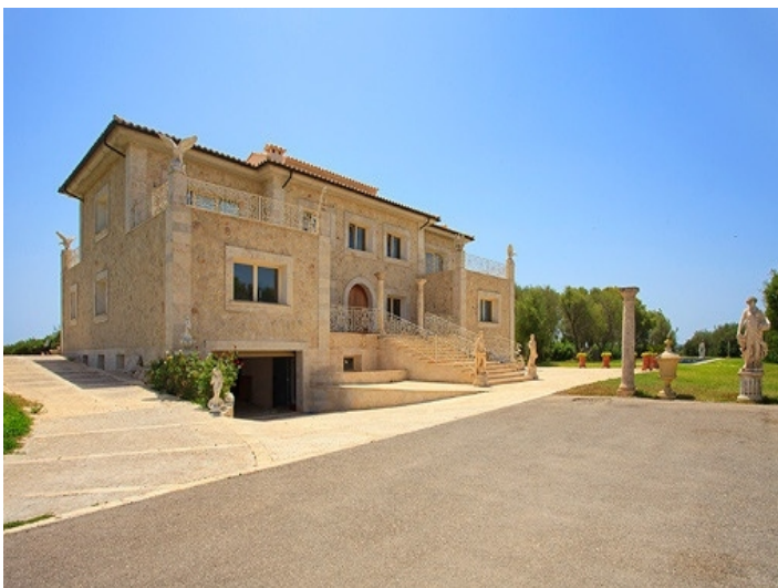
Repräsentative Auffahrt zur Villa