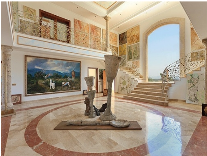
Panoramablick aus der Eingangshalle