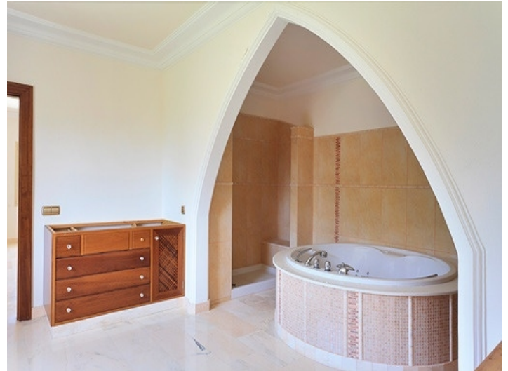
Jacuzzi für die beiden Schlafzimmer im Erdgeschoss