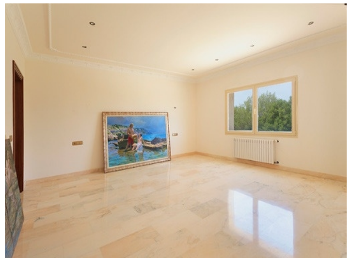
Ein helles weiteres Schlafzimmer