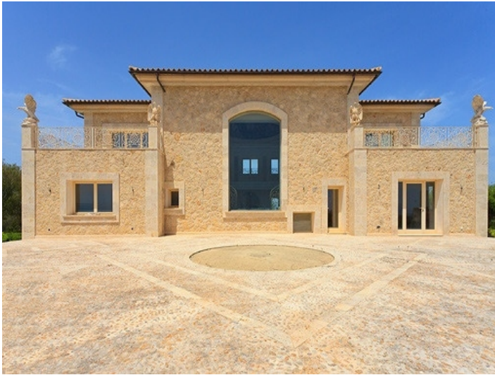
Frontansicht der repräsentativen Villa