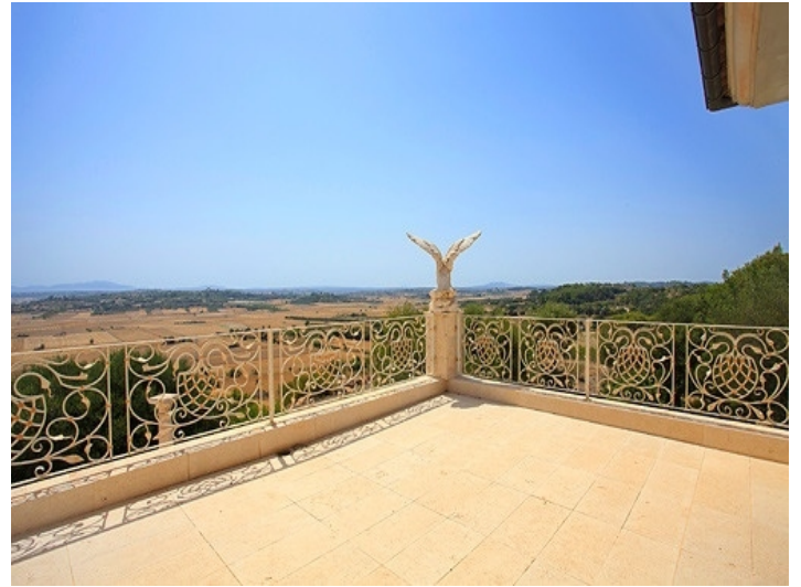
Herrlicher Ausblick über die Landschaft vom Balkon des