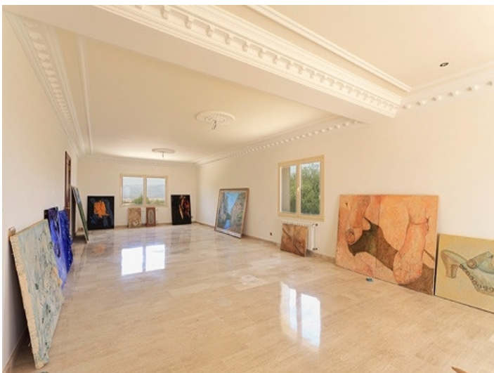
Weitläufiger Küchen- und Essbereich