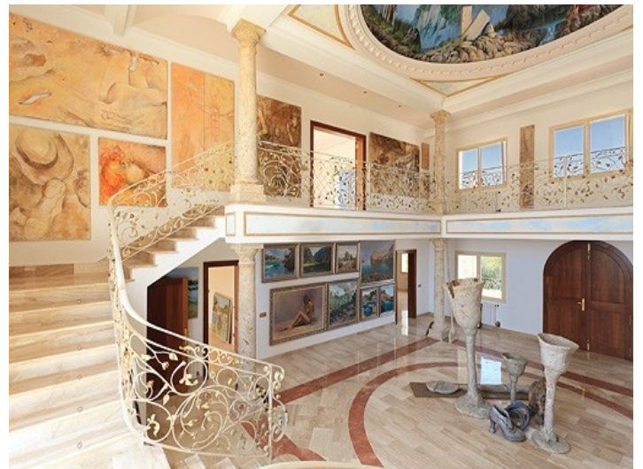
Eine dreiläufige U-Treppe führt zur Galerie