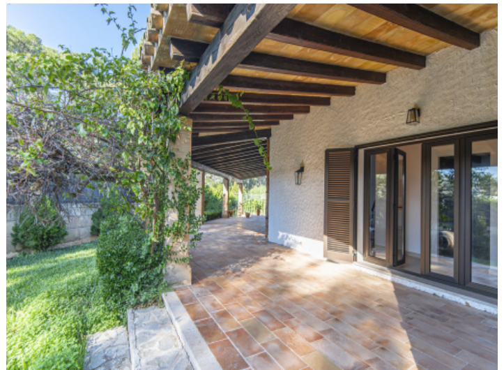
Direkter Gartenzugang von der Terrasse