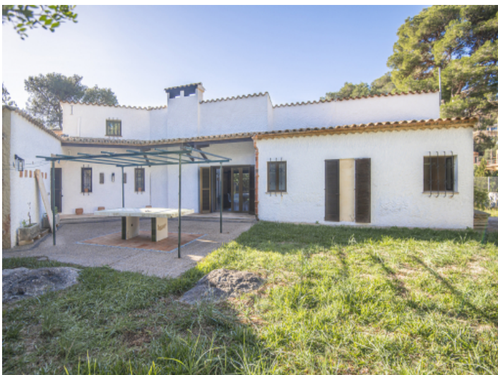
Ideal für Gartenliebhaber