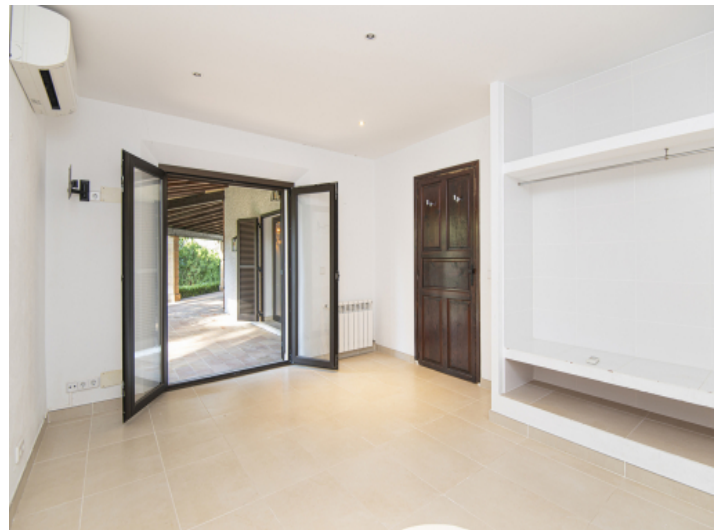
Schlafzimmer mit Terrassenzugang