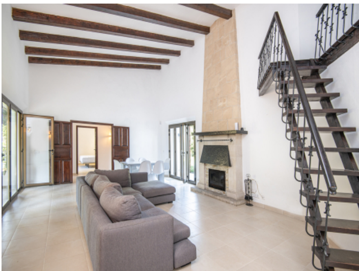
Treppenaufgang zur Schlafgalerie