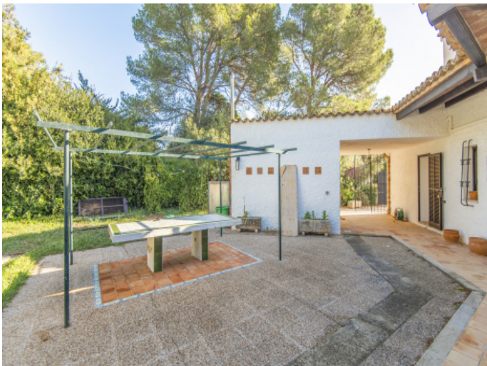
Hintere Bereich des Hauses mit Privatsphäre