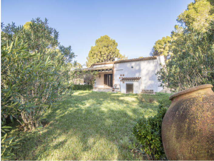
Frontansicht des Hauses