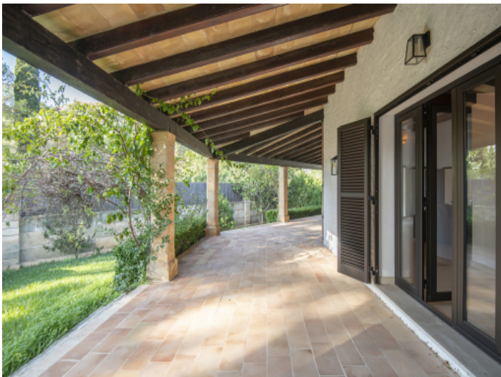
Die überdachte Terrasse ist vom Wohnzimmer aus erreichbar