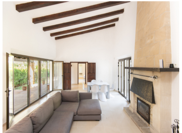
Wohnbereich mit stimmungsvollen Kamin