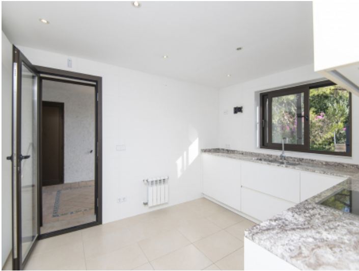
Küche mit Zugang in den Außenbereich