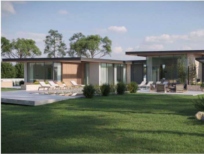
Weitläufiger Außenbereich mit Pool und Garten