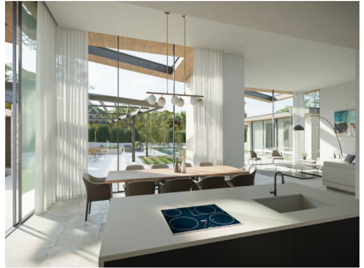
Essbereich mit offener Küche