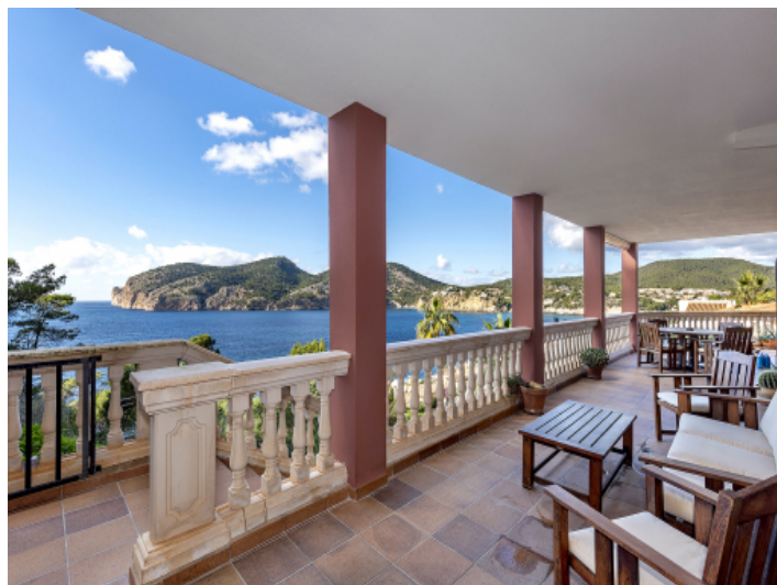
Terrasse mit Meerblick