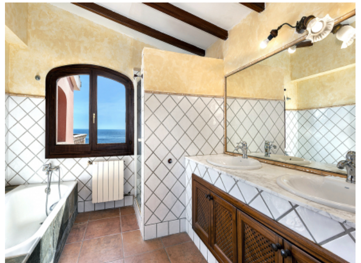
Badezimmer der Suite