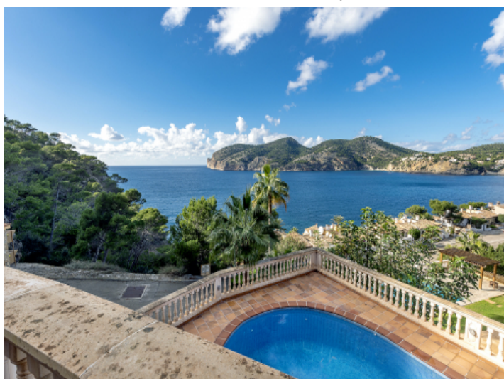
Villa mit Pool und Meerblick in Camp de Mar