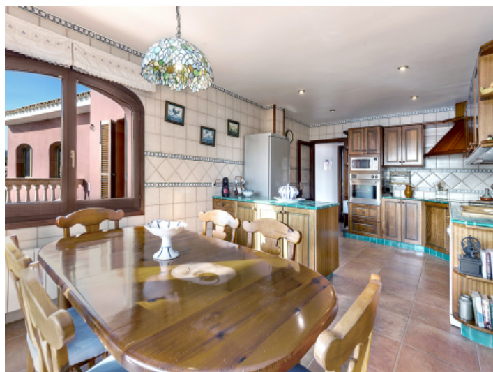
Küche mit Essbereich