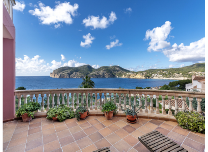
Blick auf das Meer