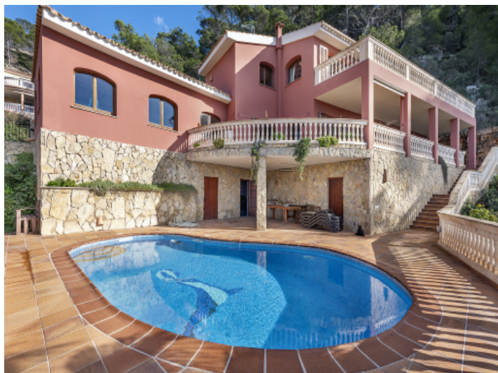
Außenansicht der Villa in Camp de Mar