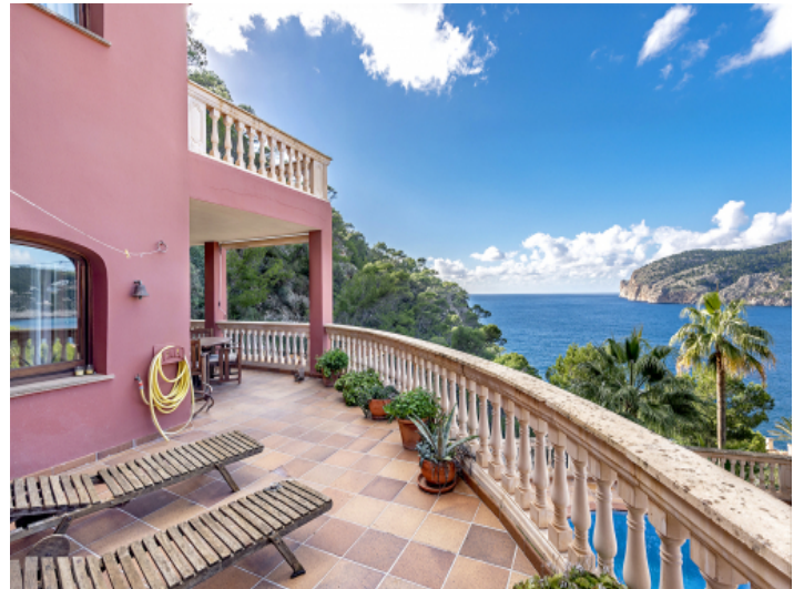
Terrasse mit Sonnenliegen