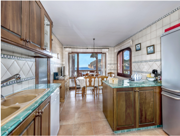
Küche mit Essbereich