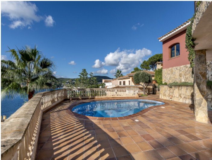
Sonnige Terrasse mit Pool