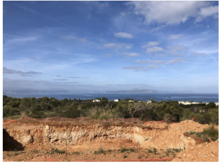
Weitblick bis hin zum Meer