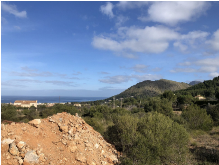
Arta ist ca. 6km entfernt