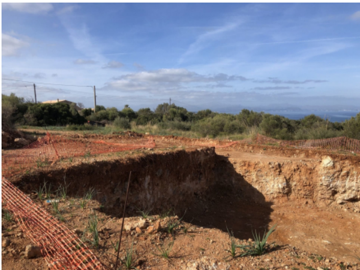
16.000 qm Bauland