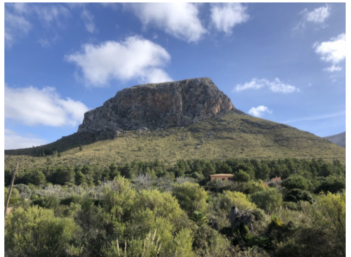
Aussicht auf den Mont Ferrutz