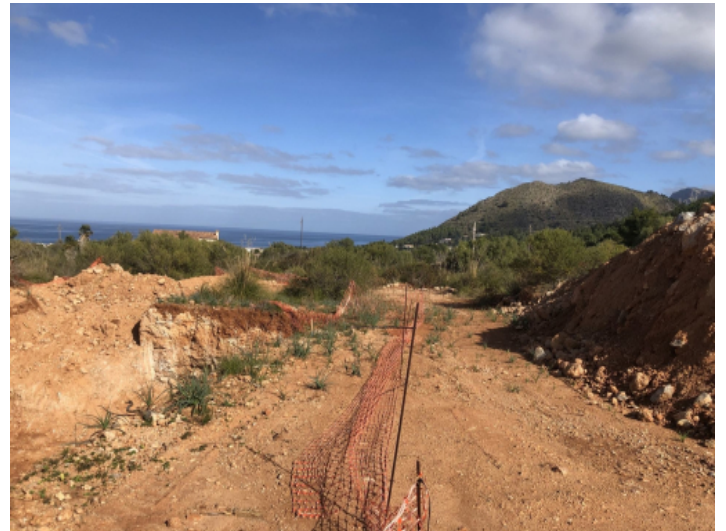
16.000 qm Bauland