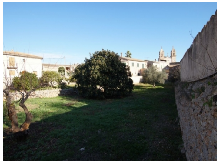
Ansicht des Grundstücks