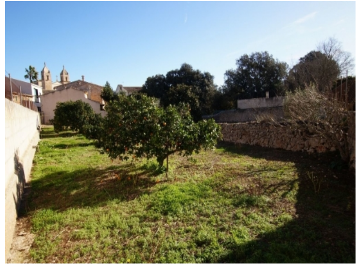
Ansicht des Grundstücks