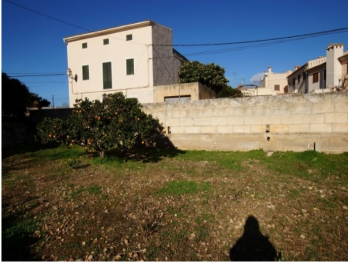
Ansicht des Grundstücks