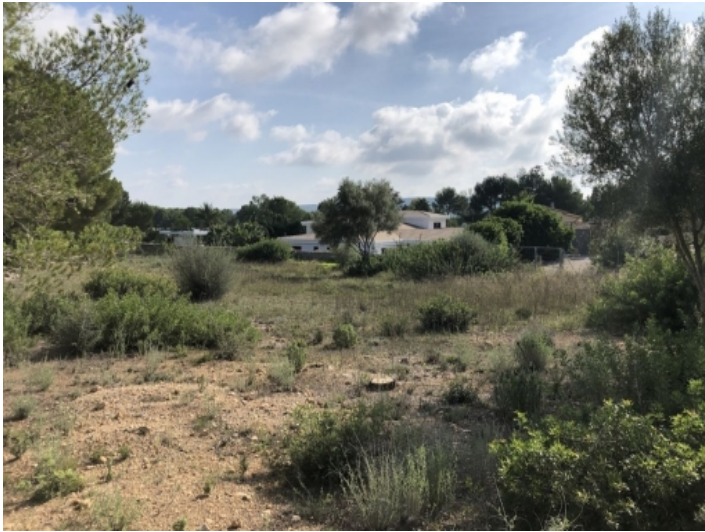
Ansicht des Grundstücks