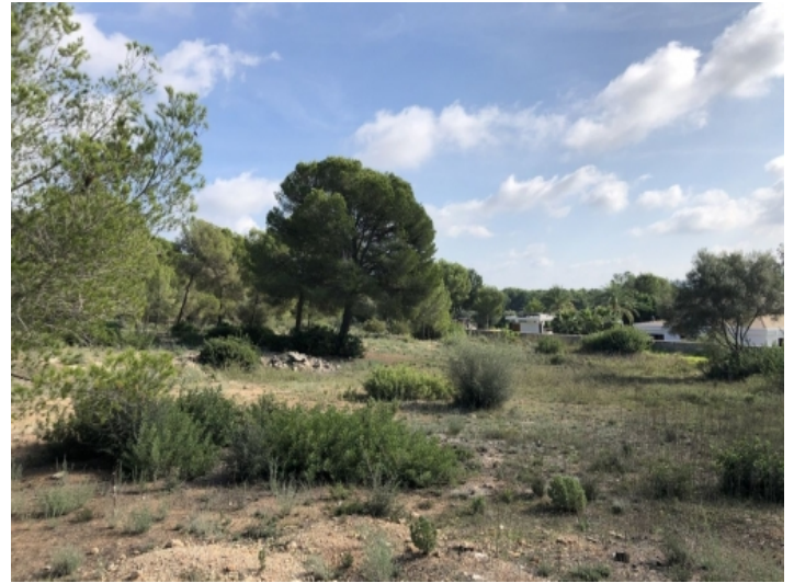
Golfplätze ganz in der Nähe