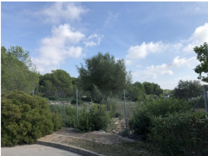
Zugang zu dem Grundstück