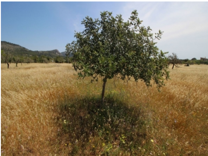
Das Grundstück hat zahlreiche Mandel- und Johannisbrotbäume