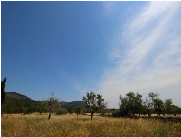
Blick auf den Puig de Randa