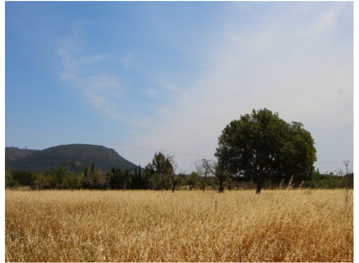
Großes 21.800 qm Grundstück