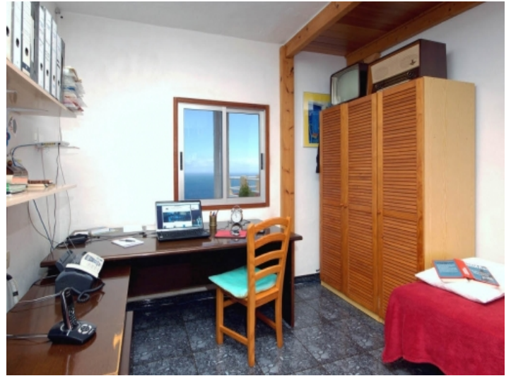
The second bedroom, currently used as an office