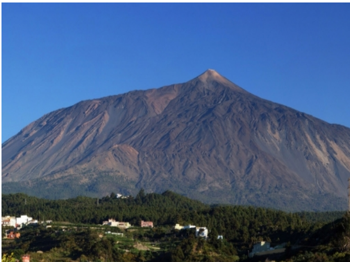
The most impressive perspective provides the Teide just here