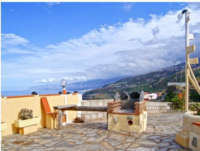
Pleasant facilities on the terrace