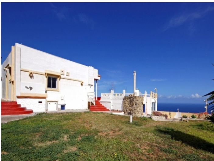
Main and guest house of the Finca