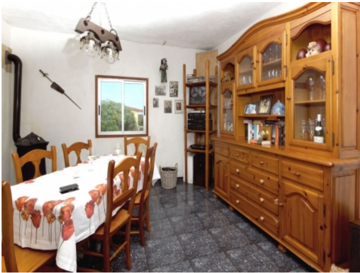
Living area in the main house of the Finca