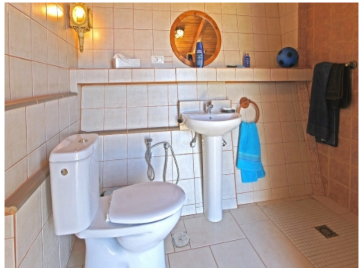
Shower room of the main apartment