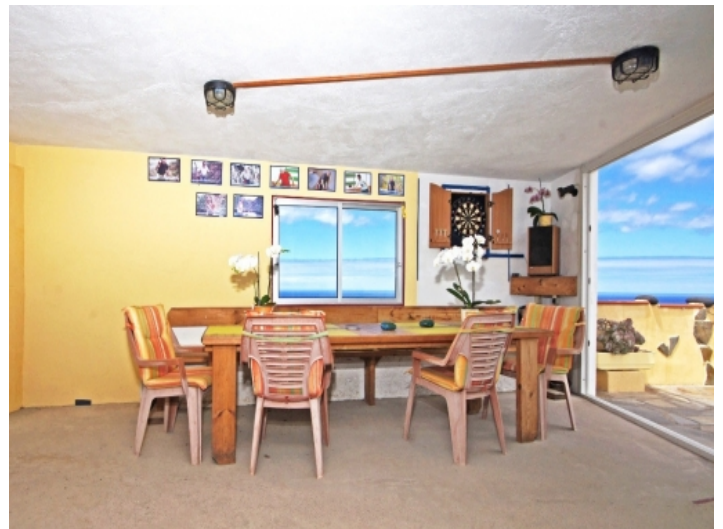
Common room at the Sea View Terrace