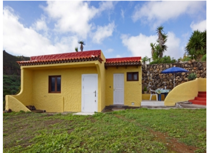
Separate house for guests, storage, office, etc., with practical