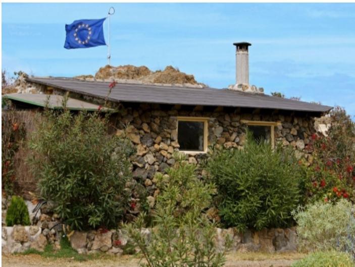
Nostalgic look of the cottage on the upper plot ....