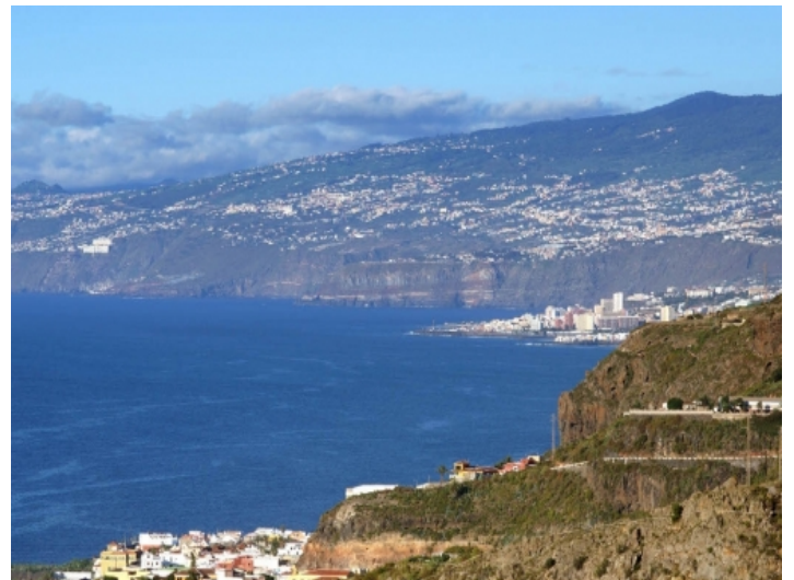
The coast of Tenerife with the skyline of Puerto de la Cruz