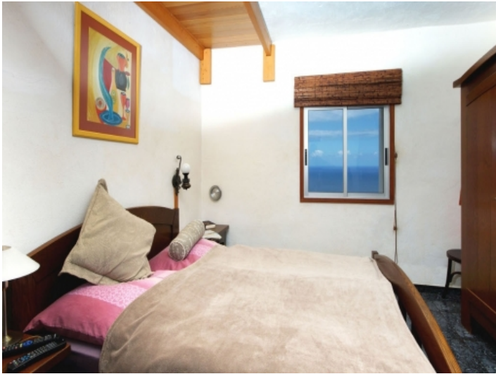
Bedroom in the main house