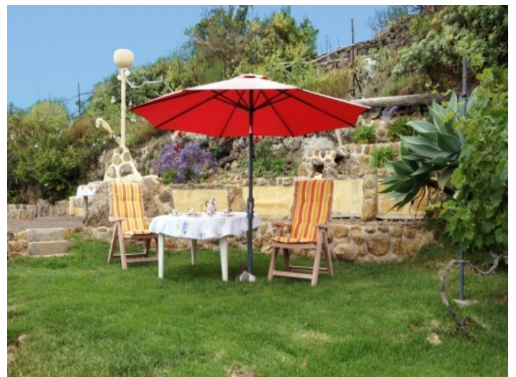
There are many opportunities to relax