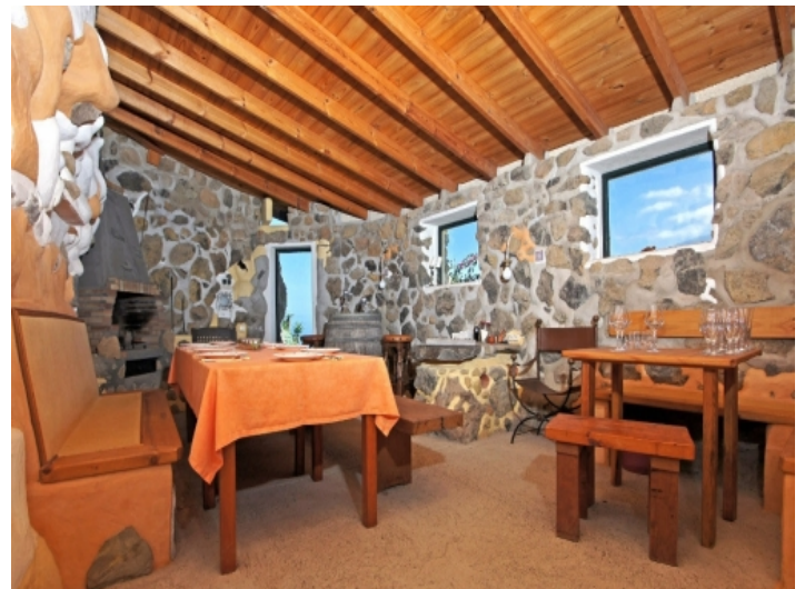
.... with nice ambience for parties