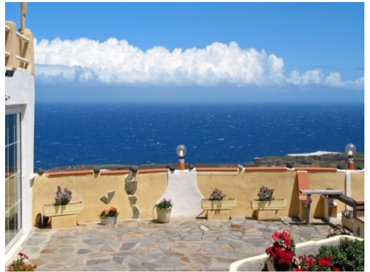
Fantastic views from the terraces