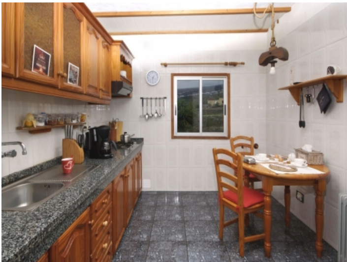
Large kitchen with dining area