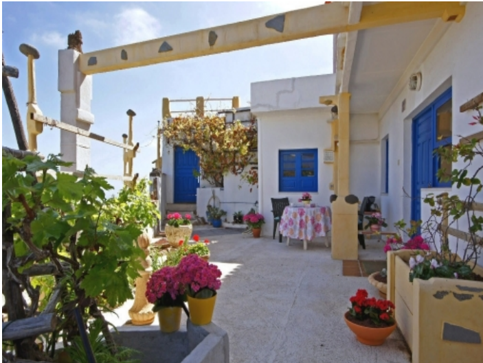
More sea view terraces on the guest area of the Finca