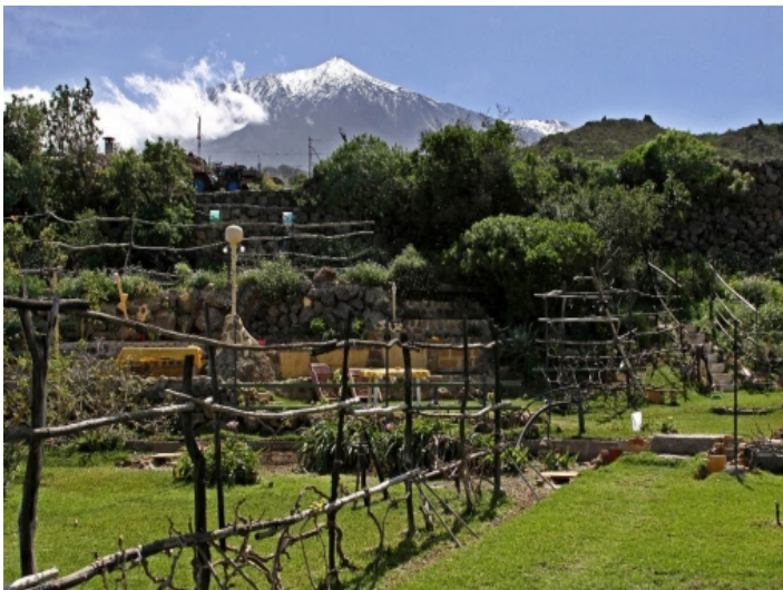
Level acreage, beautiful spots in the garden and the Teide